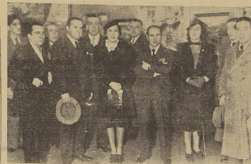
Parte de los asistentes a la exposición del pintor Pacheco Altamirano, que se inauguró ayer con éxito en la Sala Banco de Chile