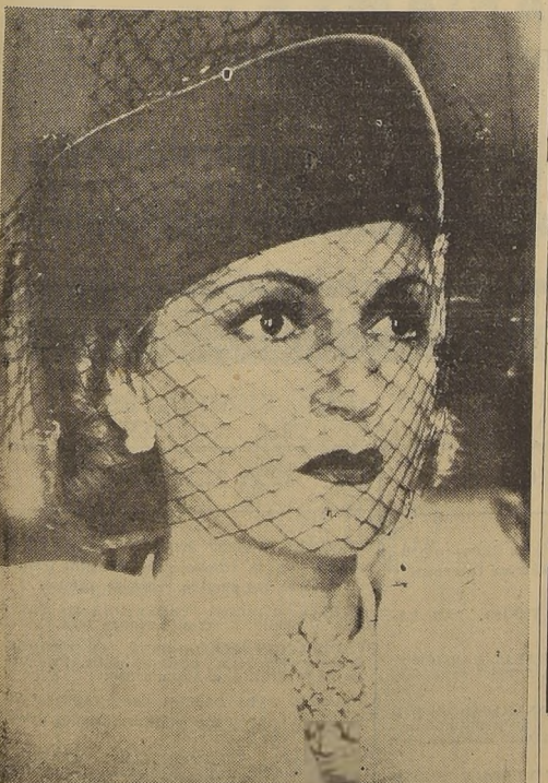
Es Vera Korene, la célebre actriz francesa, que anima la figura central de "Café de Paris", el estreno de hoy en el Teatro Baquedano.