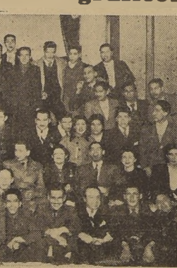
Asistentes a la manifestación ofrecida a los reporteros gráficos en la Sociedad de Artesanos