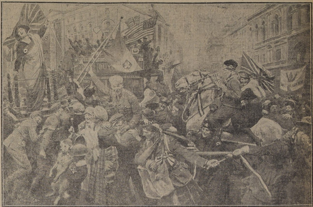
CON OCASION DEL ARMISTICIO, SE CELEBRARON FIESTAS PARA DAR EXPANSION AL ENTUSIASMO POPULAR DURANTE SIETE DIAS SEGUIDOS EN LONDRES...