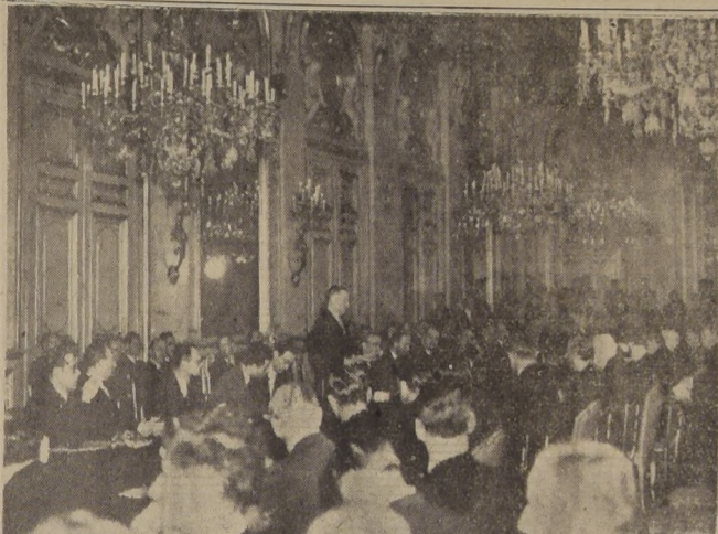
PARIS. — El Ministro de Relaciones Exteriores francés, George Bidault, se dirige a los miembros de las 16 naciones que concurren a la inauguración de la Conferencia de Cooperación Económica Europea...