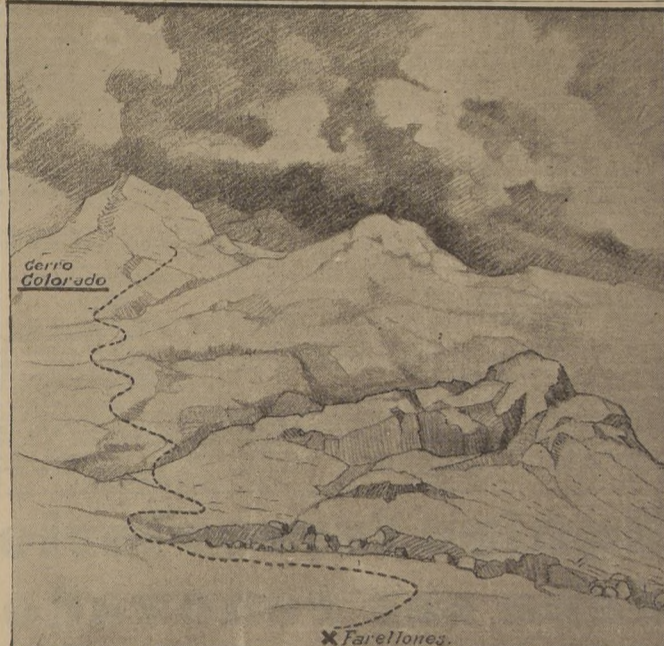
Posible ruta seguida por el señor Eric Irshberg desde Farellones al cerro Colorado, el domingo pasado. Desde entonces, nada se sabe de él, y las patrullas de salvataje han visto obstaculizada su labor por las nevadas