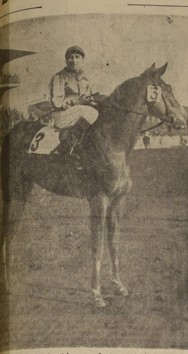
Es hija de Parlanchin, reproductor que cada día se acre...