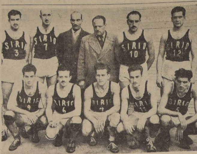
SIRIO.— El conjunto de la Colonia extranjera se impuso anoche al Barcelona por 34-27, en un partido de acciones reñidas, en la que mereció con justicia la victoria. Mahana y Durán de la Sierra, fueron sus mejores y efectivos elementos