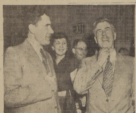
LAKE SUCCESS. - Henry Wallace, a la derecha, busca una pregunta, mientras entrevista al delegado soviético ante las Naciones Unidas, Andrei A. Gromyko, a la izquierda, durante una reunión del Consejo de Seguridad.