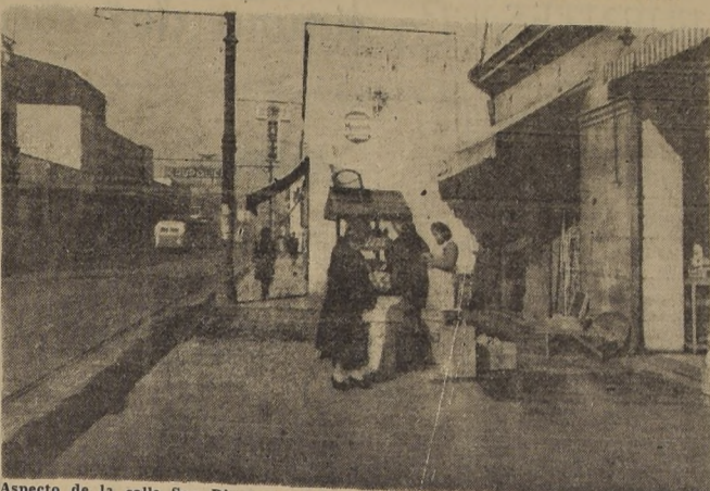
Aspecto de la calle San Diego, entre Copiapó y Coquimbo. Advértase lo angosto de la acera y el recodo antiestético que forma la saliente extraordinaria de la antigua edificación. En toda su extensión, esta calle presenta las mismas características.

Una calle de Santiago, que precisa, tal vez como ninguna otra, una preocupación preferente de las autoridades edilicias, es San Diego. Ya nos hemos referido a la particularidad que ésta tiene, de ser la entrada casi exclusiva a las populosas comunas de San Miguel, La Cisterna y San Bernardo, lo que la obliga a sopor-