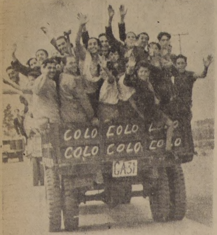
La "hinchada" de Colo Colo quiere ver ganar a su equipo en el Puerto IRAN TODOS EN TREN ESPECIAL A APLAUDIRLO