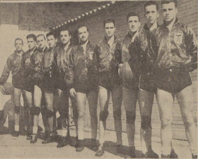
ESCUELA MILITAR.— Este es uno de los conjuntos que interviene en el campeonato especial de básquetbol universitario que se está desarrollando con señalado éxito