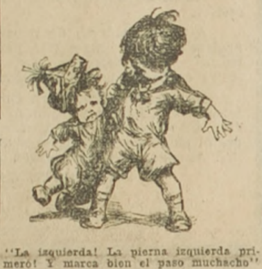
La izquierda! La pierna izquierda primero! Y marca bien el paso muchacho!