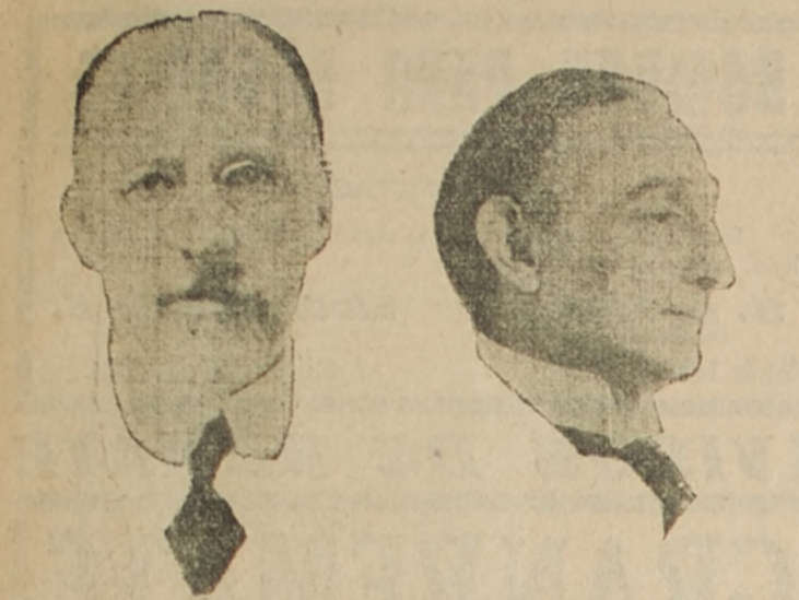
M. Cecil Arthur Spring-Rice, distinguido diplomático que desde hace varios años venia desempeñando la Embajada de la Gran Bretaña en los Estados Unidos de América