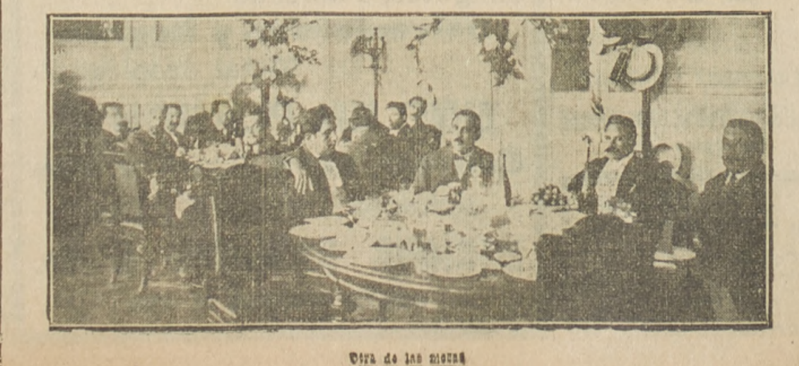
Vista de las mesas