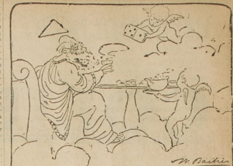
—Porque el Padre Eterno no hace terminar el conflicto mundial? —Está muy ocupado tomando Té Domino

mejante declaración, que los partidos coligados hicieran cuestión de que los señores Ministros aliados no daban garantías, cuando S. E. habría de darlas en todo caso.