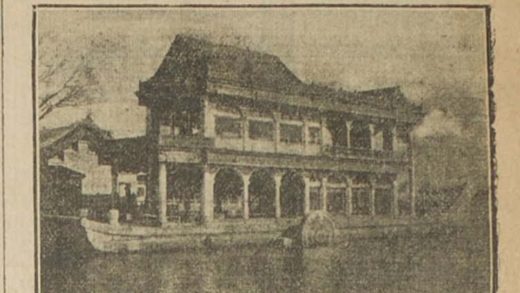
EL BUQUE DE MARMOL, UNA DE LAS MUCHAS CONSTRUCCIONES DEL PALACIO DE VERRANO DE PEKIN DONDE SE CELEBRA LA ENTREVISTA QUE HOY PUBLICAMOS

de pagar cuentas militares para llevar el bolsillo de los jefes del ejército. Hombres inteligentes y patriotas han convenido en la necesidad del licenciamiento de las tropas. El llamado empréstito de reorganización de 1912 tuvo, como objetivo la disolución de los ejércitos provinciales, que son causa constante de disturbios. Pero no se mejoraron esos fondos aplicándose al fin a que estaban destinados y el