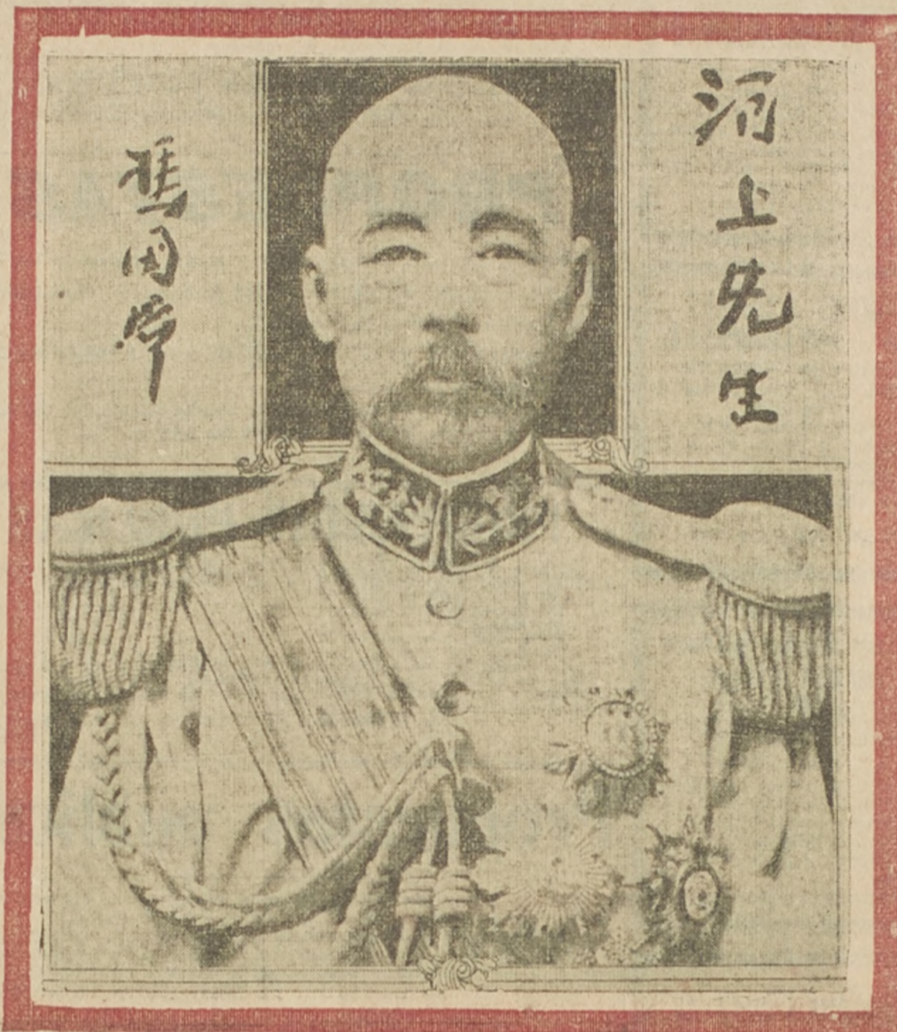
EL GENERAL FENG-KUO-CHANG, PRESIDENTE DE LA REPUBLICA CHINA EN ESTE GRABADO PUEDEN CONOCER TAMBIEN NUESTROS LECTORES EL AUTOGRAFO DEL MANDATARIO CELESTE

Feng-Kuo-Chang, Presidente de China? Esperaba encontrar en él una imponente figura con traje militar. Pero el hombre que estrechaba mi mano parecía más un comerciante o un banquero, que un poderoso general, jefe del famoso ejército de Nankín. "Su Excelencia es el tercer Presidente que tengo el honor de conocer", dijele. "No me considero Presidente contestó con énfasis. Sólo estoy actuando como Presidente. La cons-