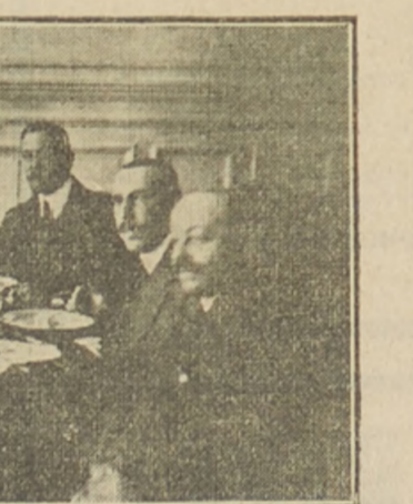
Se alejan ahora de nosotros con

intensidad sirven como de crisol para aquilatar las condiciones de talento, de carácter y los méritos individuales de los hombres que merecen el leve y que en ese camino lo toman. En cada colectividad política esos hombres se hacen oír e incorporan su espíritu equilibrado en el sentir de los demás, obteniéndose así por medio de ellos, que se mantenga un vínculo de consideración y de respeto recíproco, que da como fruto benéfico la armonía personal en el cuerpo legislativo, borrándose de este modo, en buena parte el aspecto ingrato de las tareas parlamentarias. Entre los colegas que han desollado con esos méritos, figuran los distinguidos amigos a cuyo rededor hoy nos agrupamos; y por eso es que les ofrecemos esta cariñosa despedida con noble y verdadero afecto. Es satisfactorio para ellos haber encarnado entre sus colegas este sentimiento de unión, y es honroso para los miembros de la Cámara reconocerlo y tributárselo este homenaje de adhesión, que como un destello luminoso y bené-