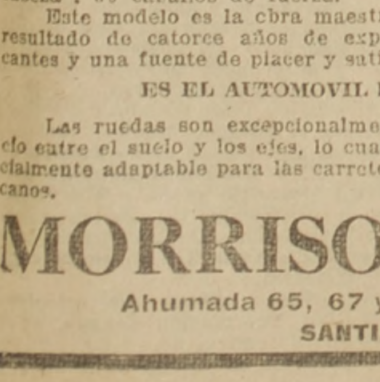
EL "TOURING CAR" BUICK DE 6 CILINDROS. Modelo EX-45. Dotado del motor Buick con "válvulas en la cabeza", 60 caballos de fuerza. Este modelo es la obra maestra de la Buick Motor Co. Es el resultado de catorce años de experiencia, el orgullo de sus fabricantes y una fuente de placer y satisfacción para sus dueños. ES EL AUTOMOVIL POR EXCELENCIA. Las ruedas son excepcionalmente altas y dejan bastante espacio entre el suelo y los ejes, lo cual hace el "BUICK SEIS" especialmente adaptable para las carreteras de los países latino-americanos. MORRISON & Co. Ahumada 65, 67 y 77, Casilla 212 SANTIAGO

Un golpe de mano alemán en la región de Nomeny, fracasó. En el resto del día ha habido relativa calma en el frente. —