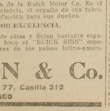
EL "TOURING CAR" BUICK DE 6 CILINDROS. Modelo EX-45. Dotado del motor Buick con "válvulas en la cabeza", 60 caballos de fuerza. Este modelo es la obra maestra de la Buick Motor Co. Es el resultado de catorce años de experiencia, el orgullo de sus fabricantes y una fuente de placer y satisfacción para sus dueños. ES EL AUTOMOVIL POR EXCELENCIA. Las ruedas son excepcionalmente altas y dejan bastante espacio entre el suelo y los ejes, lo cual hace el "BUICK SEIS" especialmente adaptable para las carreteras de los países latino-americanos. MORRISON & Co. Ahumada 65, 67 y 77, Casilla 212 SANTIAGO

Un golpe de mano alemán en la región de Nomeny, fracasó. En el resto del día ha habido relativa calma en el frente. —