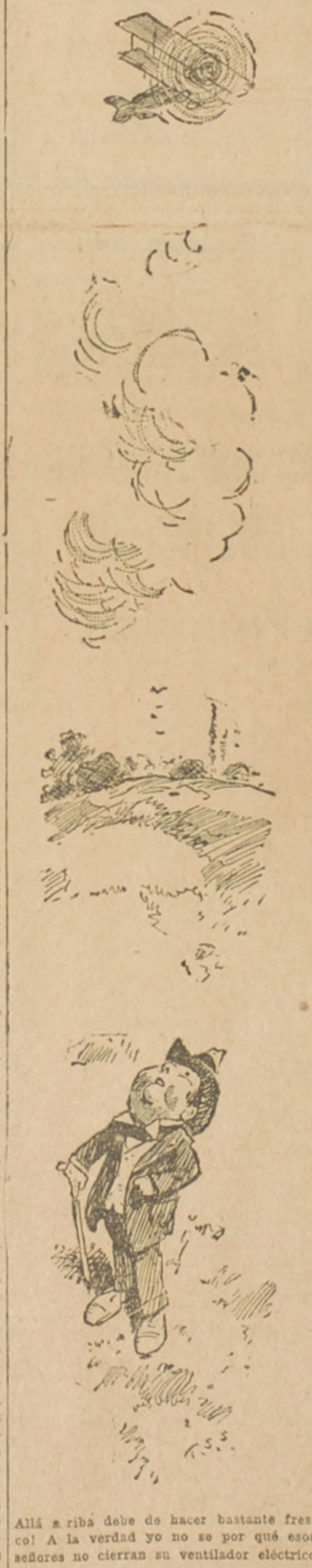
Allí ariba debe de hacer bastante fresco! A la verdad yo no sé por qué esos señores no cierran su ventilador eléctrico