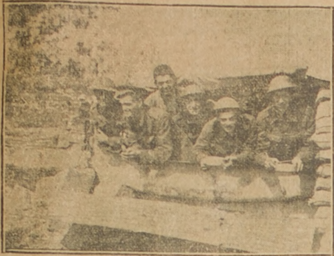
GRUPO DE ARTILLEROS BRITANICOS TOMANDO AL FRESCO SU ALMUERZO EN LA PUERTA DEL 'DUG-OUT'