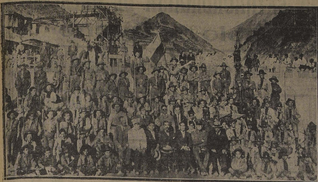
LAS BRIGADAS DE SCOUTS EN SEWELL, ESTADIO AGUA DUECE, ACOMPAÑADOS DE ALGUNOS DIRIGENTES

LAS BRIGADAS "FEDERICO ERRAZURIZ" Y "D. F. SARMIENTO" VISITARON DURANTE VARIOS DIAS EL CAMPAMENTO DE SEWEL DE ESTE MINERAL