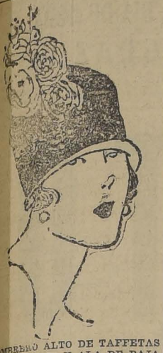
SOMBRERO ALTO DE TAFETAS AZUL MARINO Y ALA DE PAJA DE ITALIA. GRAN BOUQUET DE FLORES AL COSTADO