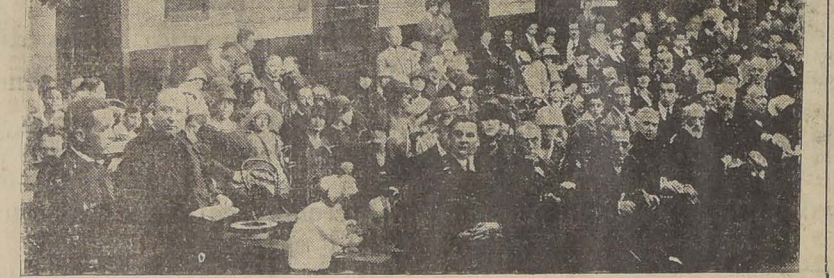
VISTA PARCIAL DE LA CONCURRENCIA QUE ASISTIO EL DOMINGO ULTIMO A LA REPARTICION DE PREMIOS