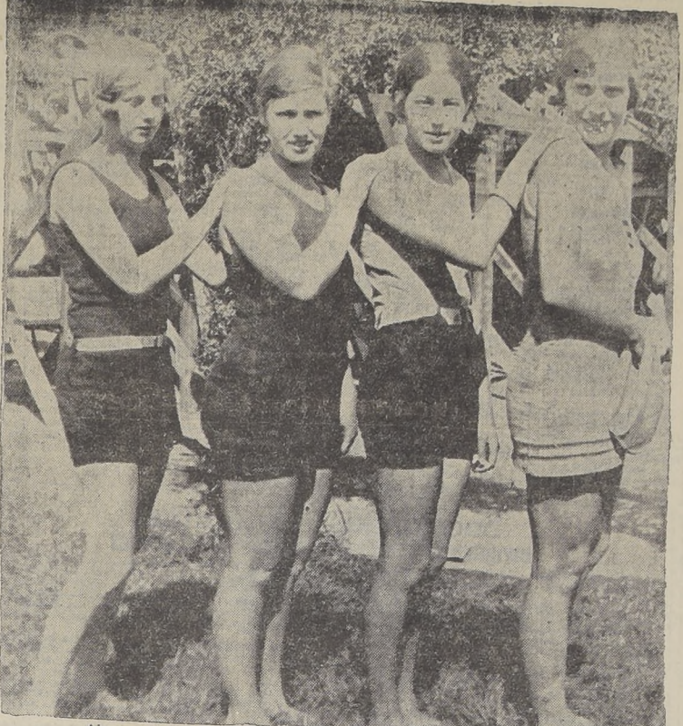
Algunas de las damas que intervienen en los 50 metros con handicap ATLETISMO

El programa de la competición incluye las siguientes pruebas: 100 metros para damas. 500 metros estilo libre para hombres. 100 metros para damas. 500 metros estilo libre para hombres. Las inscripciones se encuentran abiertas para todos los interesados. El torneo será dirigido por el señor Alfredo Barberis, presidente del Audax Club Deportivo Italiano.