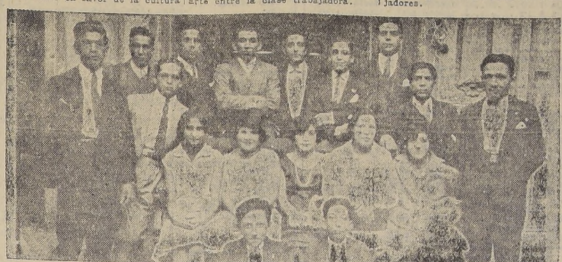
Los miembros del Conjunto "Nicanor de la Sotta" en nuestra casa