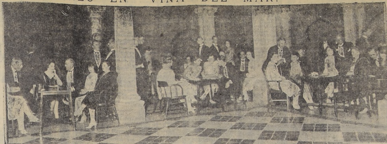
Un aspecto de la pérgola del Club de Viña del Mar durante el último "dinner-dansant"

Fiestas llenas de rebosante alegría, son la nota más simpática que tiene en la actualidad Viña del Mar.