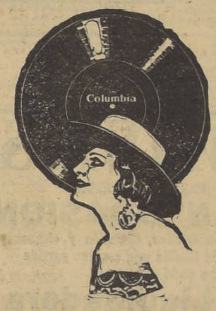
EL UNICO DISCO SIN RUIDO DE AGUJA