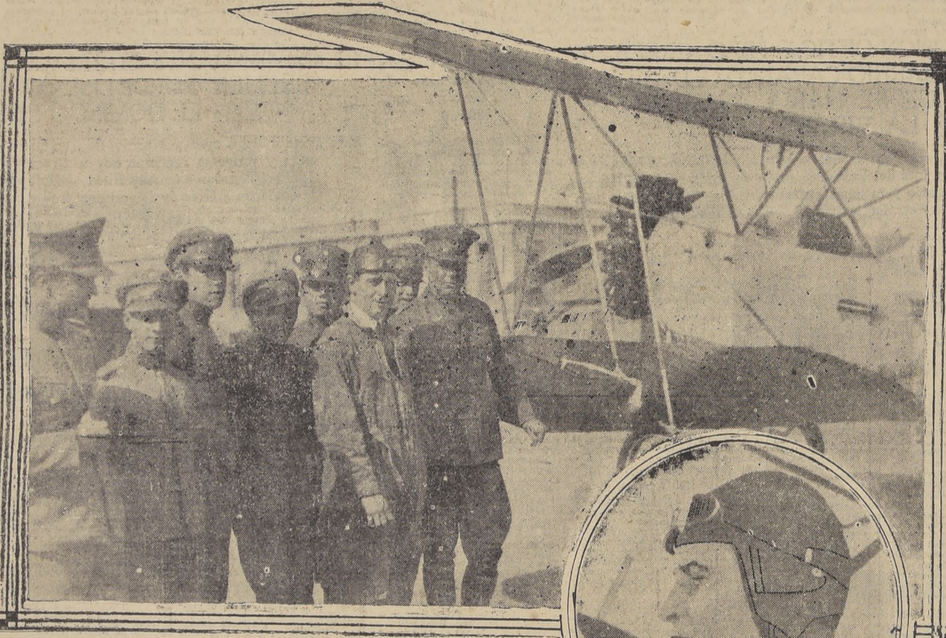
El aviador norteamericano Leigh Wade, uno de los cuatro ases de la aviación americana, que asombró al mundo con su magna proeza, al dar la vuelta al mundo en avión, es, desde hace días, huésped nuestro. Ayer en la mañana, el Teniente Wade hizo en la Escuela de Aviación de "El Bosque" una demostración aérea en su avión "Huskey P. T. 3", que trajo desarmado en su equipaje desde Estados Unidos. En la fotografía está el aviador Wade acompañado del Comandante de la Escuela y de un grupo de pilotos de la Escuela Militar de Aviación, que admiraron sus acrobacias y las volaciones de ayer. El Teniente Wade hará hoy una nueva demostración aérea. Esta vez de carácter oficial.