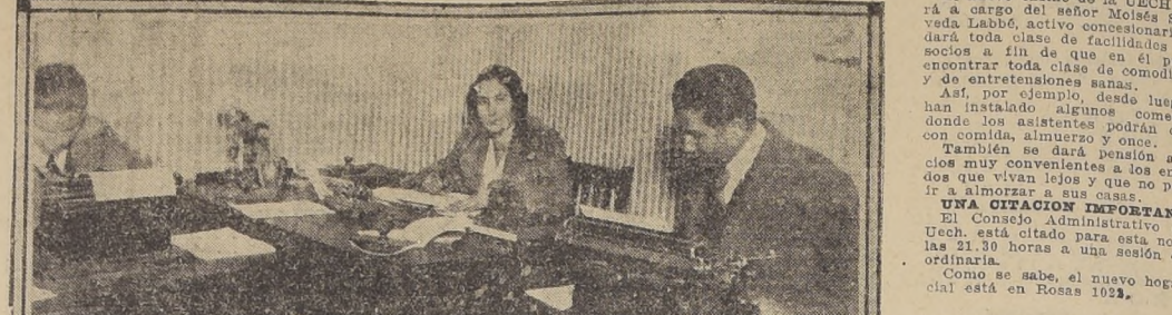
1. La oficina de la secretaria del Consejo Administrativo de la Uech — 2 y 3. Uno de los comedores y el salón de recepciones de la sociedad

Yo fui en Antofagasta fundador de la Sociedad de Unión de Empleados de Chile, y cuando en Valparaíso se fundó esta institución, se tomaron como bases los estatutos de la nuestra.