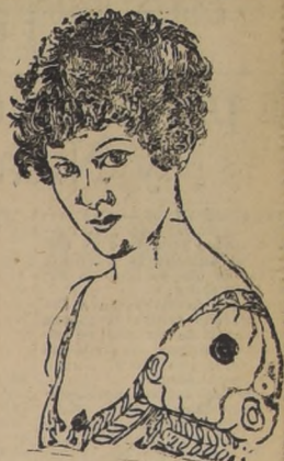
JOSEFINA DE BEAUHARNAIS

1.ª EPOCA: NAPOLEON Y LA REVOLUCION FRANCESA