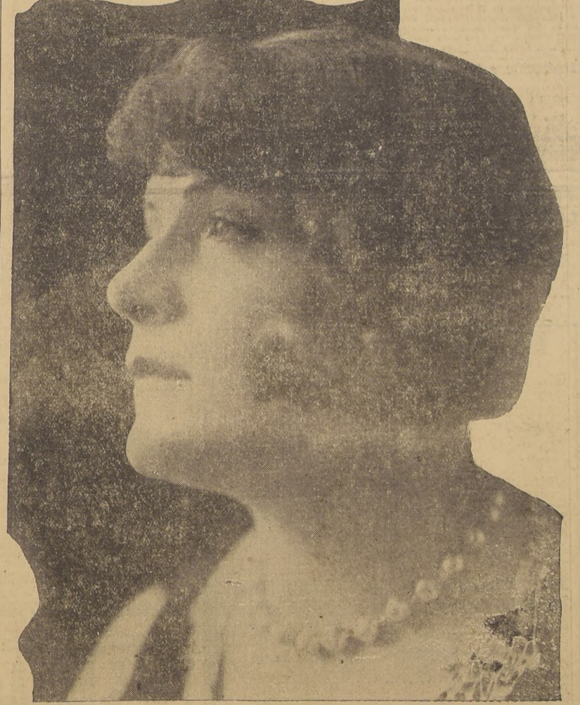
Inés Alfani-Tellini, soprano del Scala de Milán, que actuará este año en el Municipal