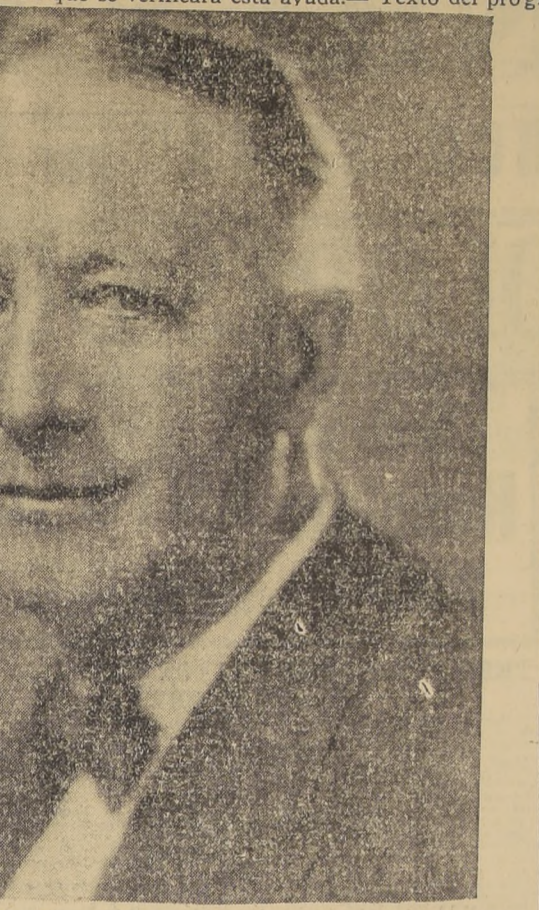
Mr. Alfred E. Smith, designado candidato demócrata a la Presidencia de la República de EE. UU. de todos los armamentos, a la países en el campo de las prenegociaciones para una guerra y al que se ha entablado entre los

de todos los armamentos, a la países en el campo de las prenegociaciones para una guerra y al que se ha entablado entre los