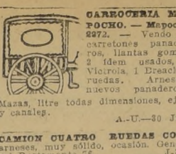
5. AUTOMOVILES Y RODADOS EN GENERAL

100 y 400. BUENAS CASAS, FA... 105, ARRENDASE CASA, SIN NI... 350, ARRENDASE CASA ALTO... 150 ARRENDADO CASA QUIN... 5 plazas etc. Maria Auxiliadora 181 Llano Subercaseaux. J-2