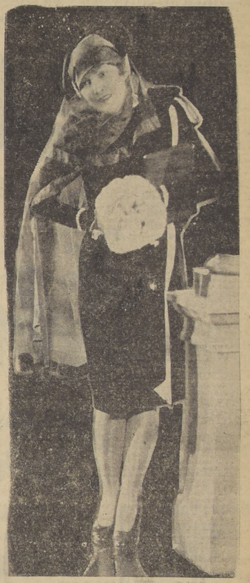
La conocerá el JUEVES en el SPLENDID, como

Tuvo la mala suerte de enviudar a los cinco minutos de casada, y quedó como LA VIUDA JOVEN Y RICA QUE CON UN OJLLORA Y EL OTRO REPICA