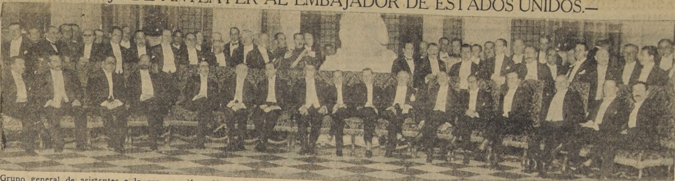
Grupo general de asistentes a la gran manifestación ofrecida por el Ministro de Relaciones Exteriores, señor Ríos Gallardo, en honor del Embajador de Estados Unidos, Excmo. señor Collier, con motivo del regreso a su patria

LA FELICIDAD.— LA FELICIDAD ES ESA CASA TAN ALEGRE, TAN BONITA, CUBIERTA DE FLORES. ES NECESARIO PARARSE AL FRENTE; SI USTEDES ENTRAN, NO LA VEN MAS.—ALPHONSE CARR.