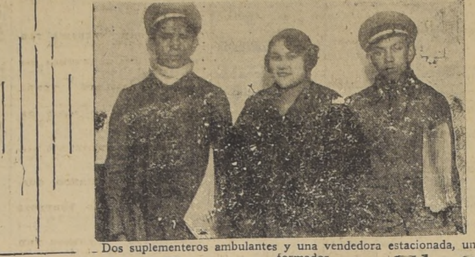
Dos suplementeros ambulantes y una vendedora estacionada, uniformados

nosotros ganamos lo suficiente para costarnos algo mejor".