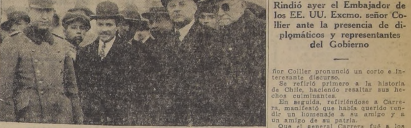
El Excmo. señor Collier y parte de la concurrencia al acto de ayer...