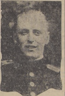
S. A. R. el Principe Olaf, heredero del trono noruego