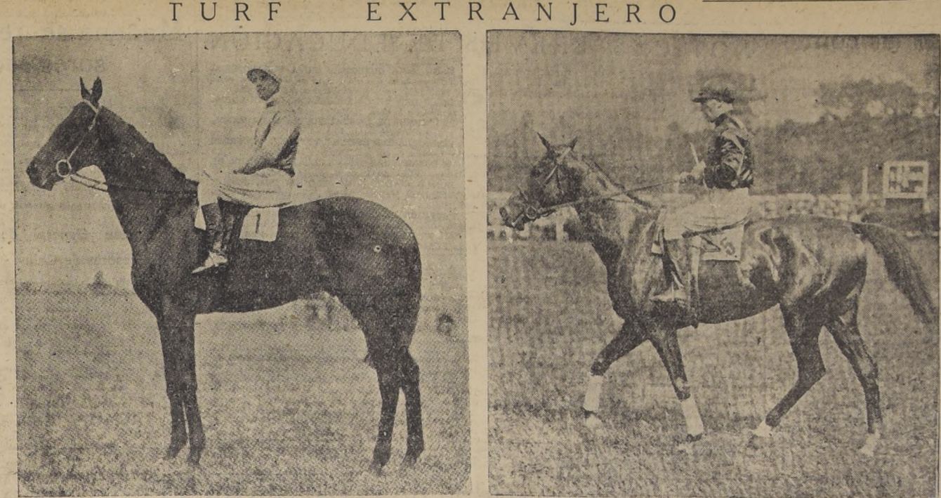
Inversh' defendió bravamente el elevage inglés, al adjudicarse la Copa de Oro de Aser, contra Quicampio, Bois, Josse lyn y otros elementos franceses de gran valía