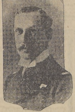
S. M. Haakon VII, Rey de Noruega

unían con la Casa Real de Inglaterra. AGENAS CARACTERISTICAS GENERALES DE NORUEGA