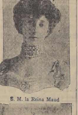
S. M. la Reina Maud