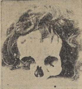
La cabellera rubia adherida a una calavera

Monckeberg, ha puesto en juego, por su parte, todo su interés y actividad para realizar en la mejor forma la resolución de la autoridad local. En efecto, según informaciones que pudimos obtener, hará estucar las construcciones que forman la plazuela del Cementerio General, con el mismo estuco que tiene en la actualidad su frontis.