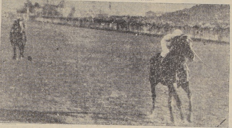
Cantimplora, al petit galop