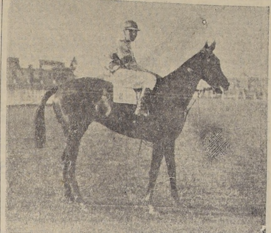
Jaspecia, por Salpición y Sungalia, que ayer abandonó la categoría de perdedores. Pertence al Stud Buena Vida, y fué guiada por F. Alvarez.

LA NOTABLE HIJA DE GAULOIS BATIÓ A SAL SOLA POR 6 CUERPOS Y RECORRIÓ LOS 1,800 METROS EN 1.48 3/5. RECORD DE CHILE.—LA SOCIA Y JASPECIA SALIERON DE PERDEDORES.—EJEA SORPRENDIÓ A LA CATE-LICOE, EN EL HANDICAP DE FONDO.—GUAU, ALCE Y EL DUERO, EN LAS PRUEBAS RESTANTES.—RELACION Y RESULTADOS GENERALES—NOTICIAS DIVERSAS Y PROXIMAS INSCRIPCIONES