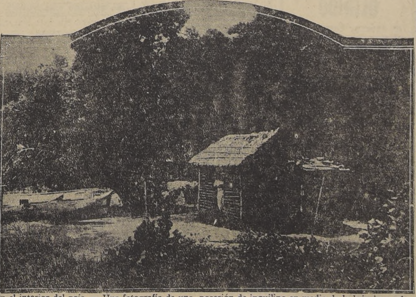
En el interior del país. — Una fotografía de una posesión de inquilino en medio de la lujuriosa selva tropical.