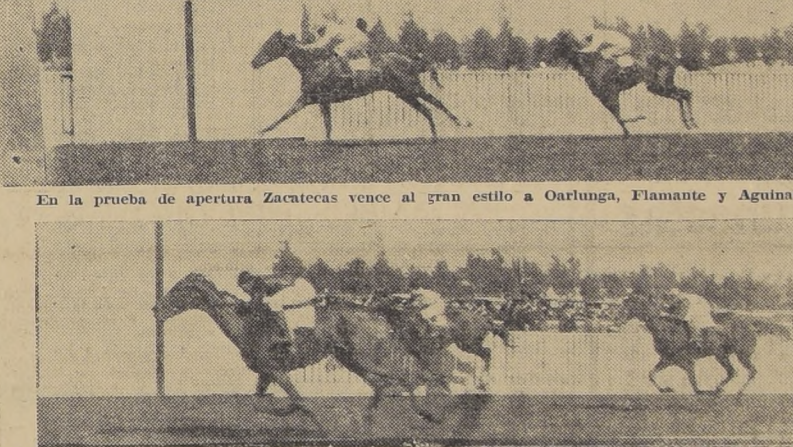
Glenluce hace suyo el premio "Año Nuevo", carrera básica del programa, aventajando por 3/4 de cuerpo a Sunbeam. Ter cera Bagatela