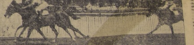
Barbaridad, en el disco mismo, se impone por media cabeza sobre Altamira en la tercera carrera