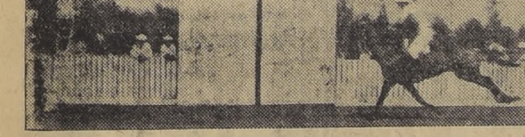
Llegada del premio "Polo": 1.º Manuelillo, 2.º Kid Moró, por fuera; 3.º Alabama y 4.º Pepe