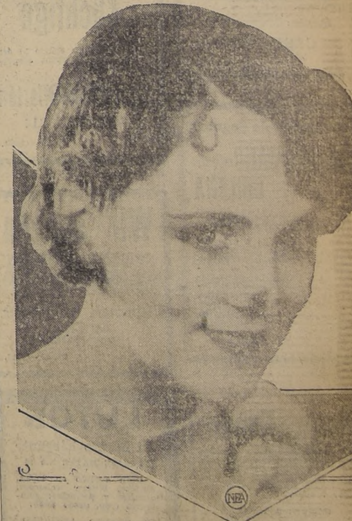
Durante más de un año, Carryl Lincoln, bella y joven actriz cinematográfica...