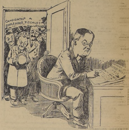
Ya es hora de que emplee la "buena voluntad" en casa. ("NEW YORK TIMES").