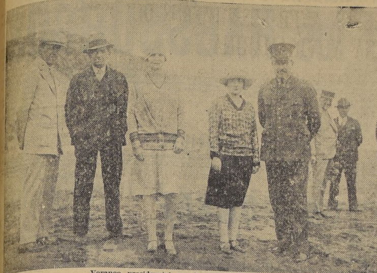
Veraneo presidencial en las playas de Constitución