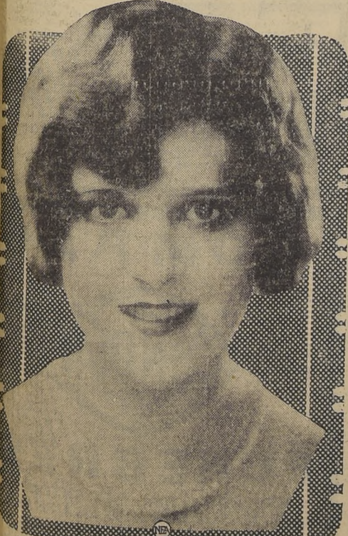
Dorothy Gulliver, una de las estrellas más jóvenes de la cinematografía mundial...