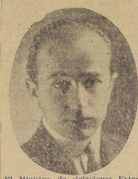
El Ministro de Relaciones Exteriores, don Conrado Ríos Gallardo, que fué condecorado ayer.

TAMBIEN SE OTORGAN DISTINCIONES A ALTOS FUNCIONARIOS DE LA CANCELLERIA.—J.A CEREMONIA SE EFECTUO EN EL SALON ROJO DEL MINISTERIO DE RELACIONES EXTERIORES