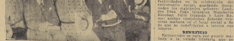
Asistentes a la junta general extraordinaria celebrada anoche para dar cuenta de las actividades sociales