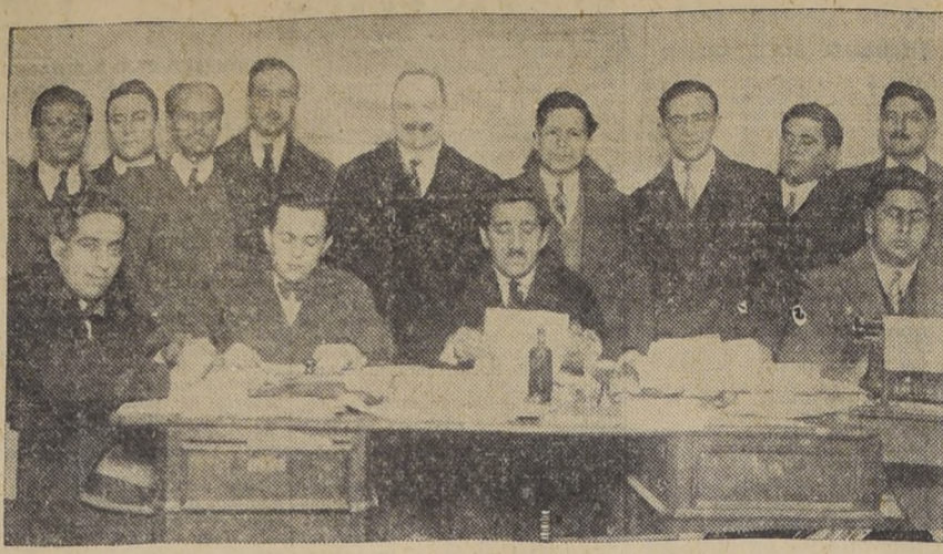
El Directorio y las comisiones de trabajo recientemente constituidas.