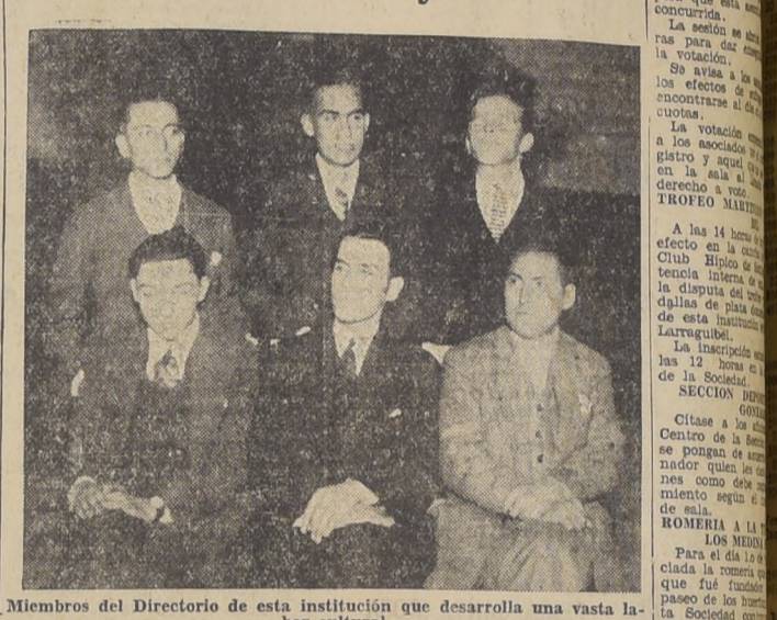
Miembros del Directorio de esta institución que desarrolla una vasta labor cultural.