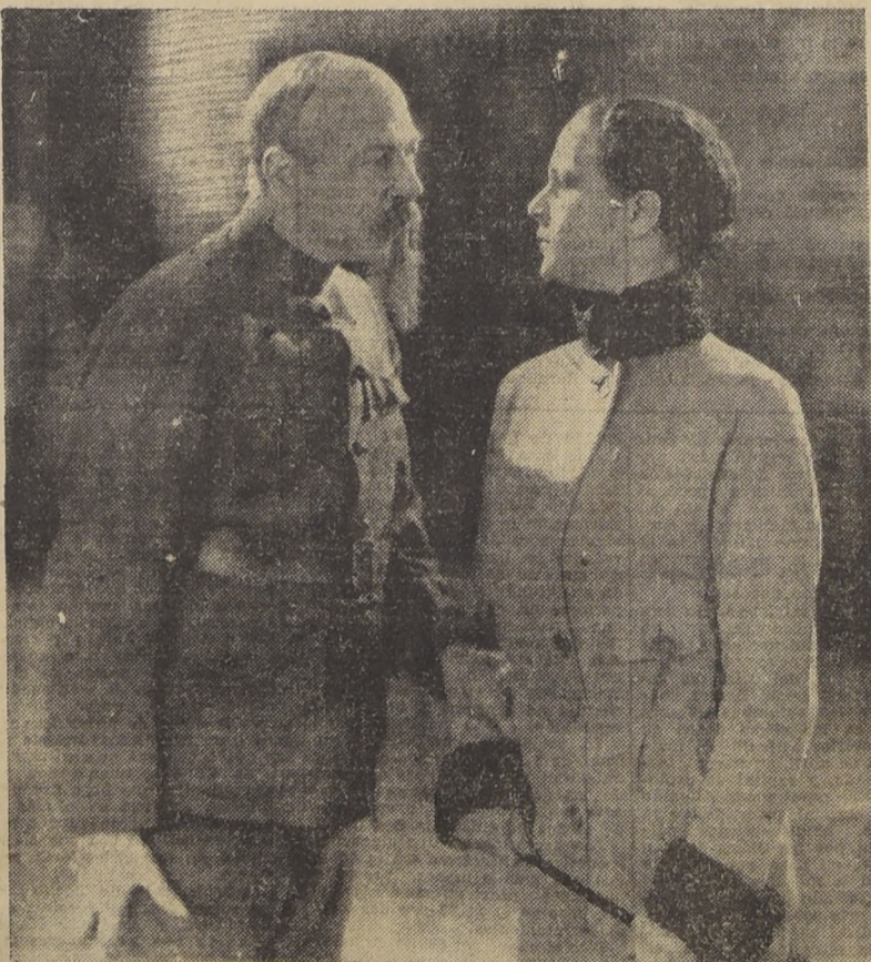
Una escena de esta película gigante, que nos muestra el INFIERNO DEL SOVIET y sus terribles privaciones, donde la justicia y la personalidad humanas son un eco sin valor.