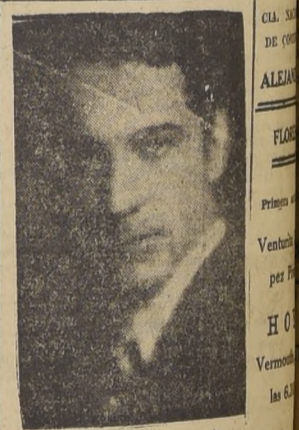
Estreno en este teatro de la hermosa obra de Acevedo Hernández y Calmettes