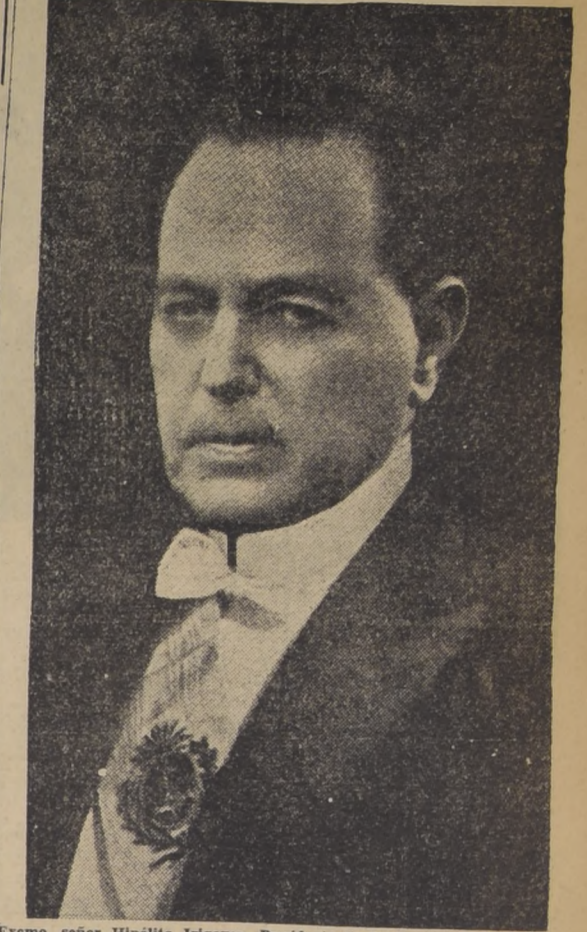
Excmo. señor Hipólito Irigoyen, Presidente de la República Argentina.