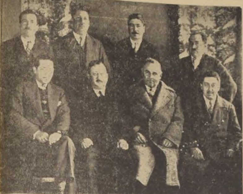
Directorio de la Sociedad de Comerciantes e Industriales de Puente Alto

En el Clarillo habrá un banquete. — Se dictará una conferencia sobre la Ley 4054 y sobre "Ventajas de la Asociación"