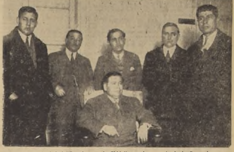
Directorio de la Sociedad "Practicantes de Chile", que ha organizado la fiesta de esta noche

En el amplio salón-teatro que la Unión de Peluqueros posee en Tarapacá se llevará a efecto esta noche, a las 21.30 horas, una gran velada artístico-musical organizada por el directorio de la Unión de Practicantes de Chile.