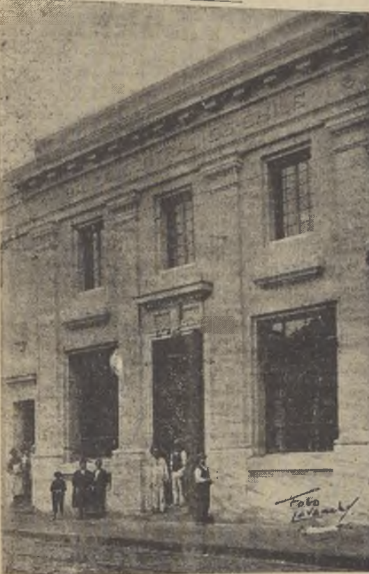
El edificio de la sucursal en Concepción del Banco Central de Chile