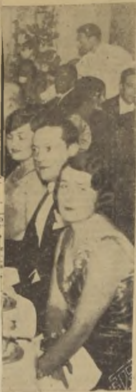
Se recibieron en esa.