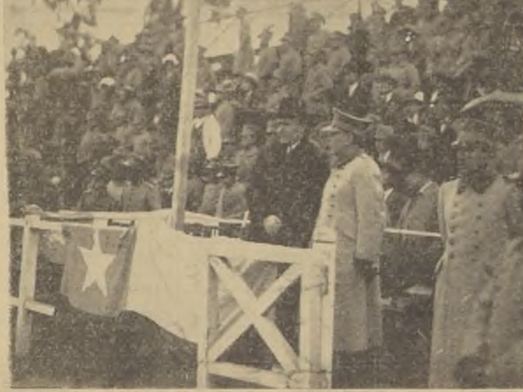
A pesar de la lluvia, S. E. el Presidente de la República presenció el desarrollo de la reunión de ayer en el Estadio Militar, correspondiente al Campeonato del Ejército.

Green Cross triunfó en basketball Venció al Nacional por 29 puntos contra 16 Una extraordinaria concurrencia asistió en la mañana de ayer a las gradas que circundan las canchas de basket ball del Estadio Gath y Chaves atraída por la reunión anunciada por la prensa local. En el partido entre el Green Cross y la Unión Deportiva Española, por Quinta División, venció el Green Cross por seis tantos contra cinco. Los equipos de Gath y Chaves y Green Cross, que debían hacer un partido por la tercera División, se presentaron, y la Y. M. C. A. ganó por 70 a 20 a la Escuela de Infantería.