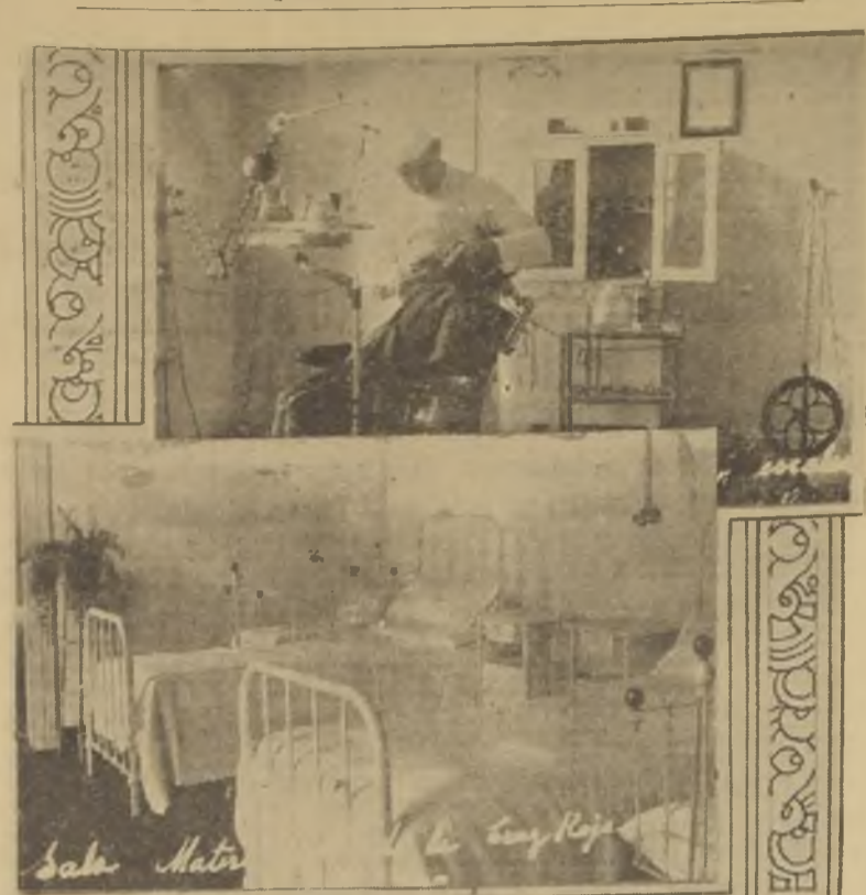
1.— Clínica dental para la atención de escolares.— 2. Sala de Maternidad.

El estado de los heridos no inspira cuidado.—(Corresponsal)