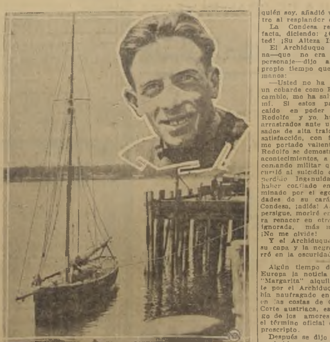
Toda Francia honró a Alain Gerbault al terminar recientemente su solitario viaje alrededor del mundo en un pequeño yate. El audaz y joven sportsman francés, cuyo busto se ve en la parte superior del grabado, navegó durante cinco años, dando la vuelta al planeta y recorriendo todos sus mares, en la pequeña embarcación a vela que se muestra en la fotografía: el "Firecrest". Gerbault fue uno de los mejores jugadores de tenis que ha tenido Francia.

quien soy, añadió volviendo a mirar al resplandor del fuego. La Condesa retrocedió estupefacta, diciendo: ¿Cómo? ¿En verdad? ¡Su Alteza Imperial! El Archiduque Juan de Toscana—que no era otro el extraño personaje—dijo a la Condesa, al propio tiempo que le tendía sus manos: "Usted no ha podido salvar un cerdazo como Rodolfo; pero en cambio, me ha salvado la honra a mí. Si estos papeles hubiesen caído en poder del Emperador, Rodolfo y yo, hubiéramos sido arrestados ante un tribunal, acusados de alta traición. Guardo la satisfacción, con todo, de haberme portado valiente hasta el fin. Rodolfo se demostró inferior a los acontecimientos, a pesar del gran comando militar que ostentaba, y recurrió al suicidio cuando se creyó perdido. Ingeniería la misma de haber corrido en su tiempo a un minuto por el egoísmo y puerilidades de su carácter. Y ahora, Condesa, ¡adiós! Aunque nadie me persigue, moriré en lo que soy para renacer en otra vida, distante, ignorada, más allá... ¡adiós! ¡No me olvide!" Y el Archiduque se emborazó en su capa y la negra silueta se borró en la oscuridad.