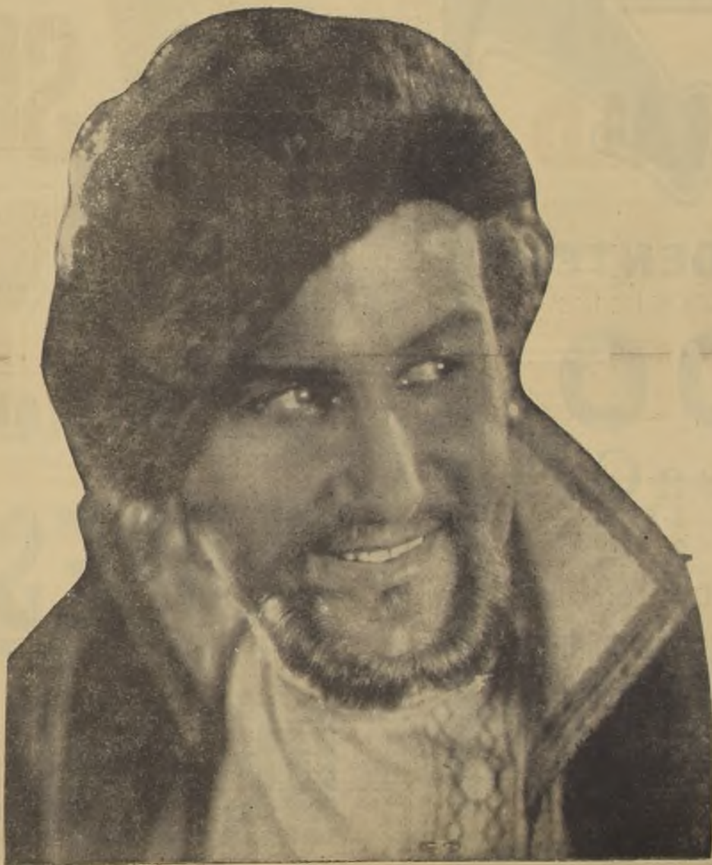
HANS SCHLETTOW EN EL ROL DE STENKA RASIN