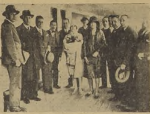
Los miembros de la Embajada a bordo del "Ebro"