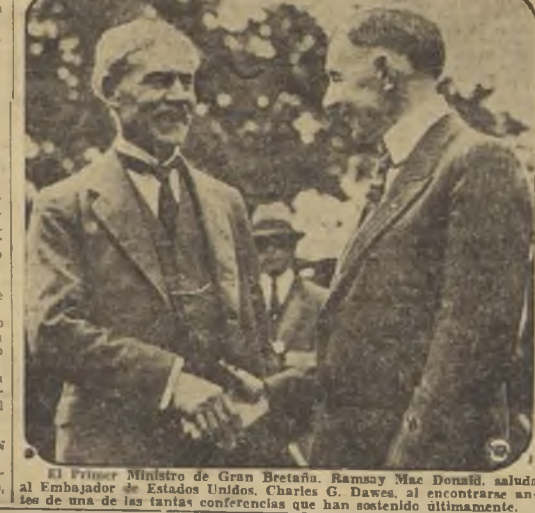
El Primer Ministro de Gran Bretaña, Ramsay Mac Donald, saludó al Embajador de los Estados Unidos, Charles G. Dawes, al encontrarse antes de una de las tantas conferencias que han sostenido últimamente.