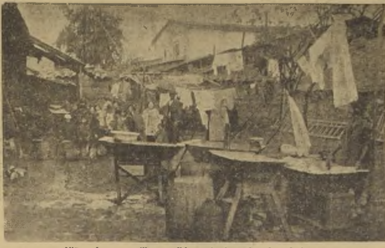
Niños de conventillo, candidatos fatales a la tuberculosis.

$ 15.000, casa escuela, calle Aconcagua, antes de Av. Matta, entre Matías y Cochran, gran almacén, plaza y jardín, más 15 x 45 mts. al lado, resto deuda hipotecaria. Tratar después: Santo Domingo 1033.