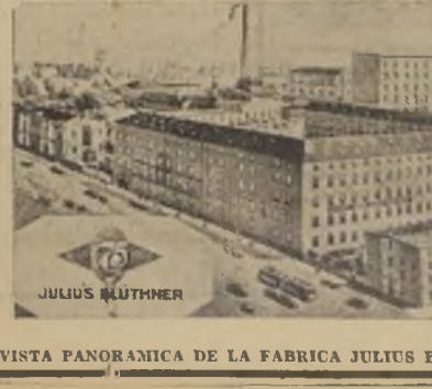
VISTA PANORAMICA DE LA FABRICA JULIUS BLUTHNER DE LEIPZIG