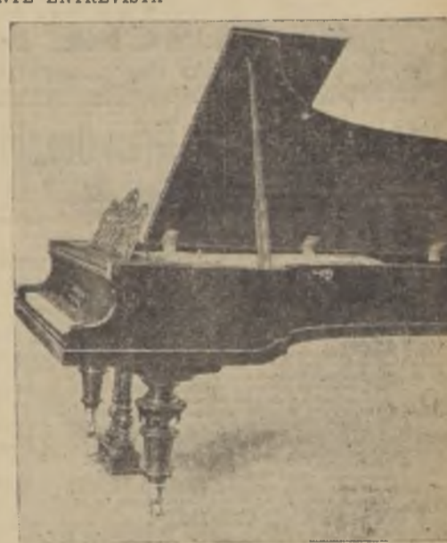
PIANO DE CONCIERTO RECONOCIDO Y ADOPTADO OFICIALMENTE POR EL CONSERVATORIO NACIONAL DE MUSICA

Es para nosotros muy halagadora la visita del Gerente y del apoderado de la afamada fábrica de pianos Julius Blüthner — comenzó diciéndonos el señor Becker. Casi siempre los grandes industriales extranjeros envían sus representantes en visita comercial a nuestra capital.