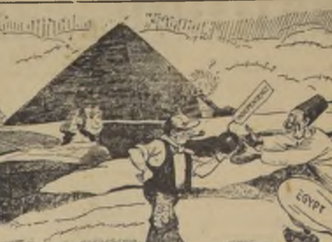
EL GOBIERNO LABORALISTA BRITANICO.—"Aquí tienes, Egipto, tu independencia". (THE HERALD, Melbourne)