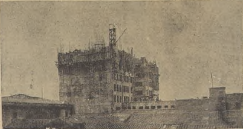
Sobre los techos viejos, el edificio destaca su esbelta arquitectura