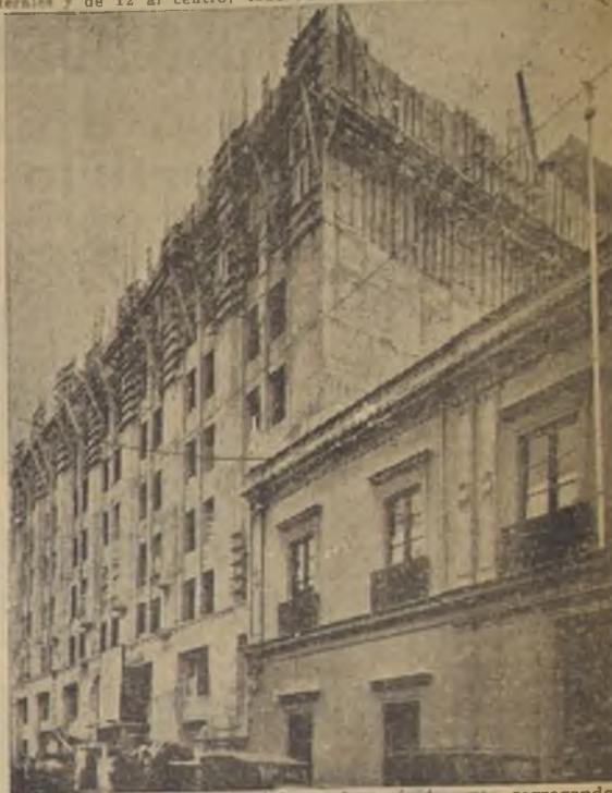
Octubre de 1929.—El andamiaje se eleva rápidamente, segregando pisos y ventanas

diferencia de los más y de los presagios negros de no pocos.