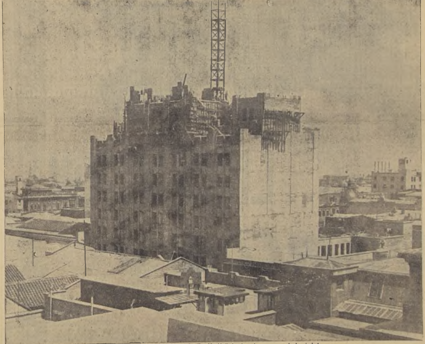
El edificio nuevo de "La Nación" domina el panorama de la ciudad

Y desde hace 13 años, toda la vida pública de Chile, en sus más diversos aspectos, aparece delineada en las "columnas" de "La Nación". Más toda la admirable evolución del presente, mereced a la cual el país se encami-