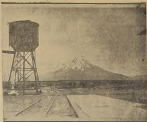
El volcán Tacora, visto desde una de las oficinas del FF. CC. de Arica a La Paz

Desde el miércoles pasado ha temblado constantemente en sus cercanías.—Un temblor, con caracteres de terremoto, ocasionó serios perjuicios.—Reina verdadero pánico en la región.—Estos fenómenos han repercutido en Arica