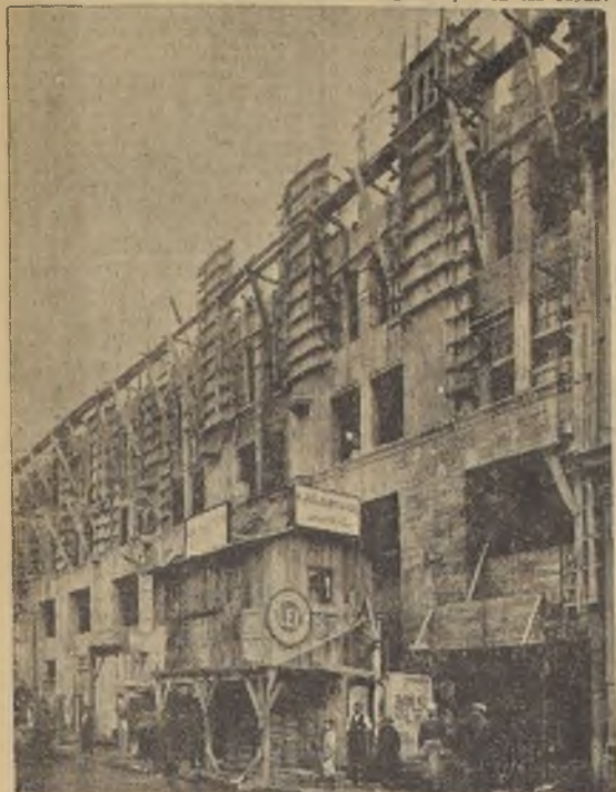
Agosto de 1929. — Sedientos de atura, los muros estran sus varillajes metálicos hacia el cielo

alios son de construcción y tipo modernísimos, en forma de que constituyen las mayores comodida-