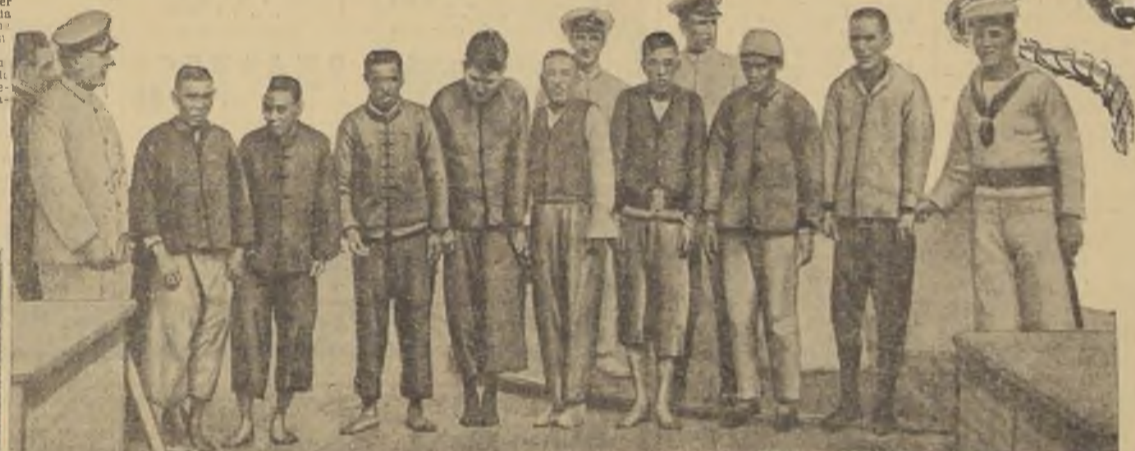
Un grupo de piratas espantados casualmente por los marinos del joven República americana, decidió tomar parte en la lucha contra los asesinos del mar.

Y mientras algunos de los piratas participaban en una danza salvaje que se asemejaba a las danzas de guerra de las pieles rojas de Norte América, otros se disputaban la muchacha luciendo sus habilidades.