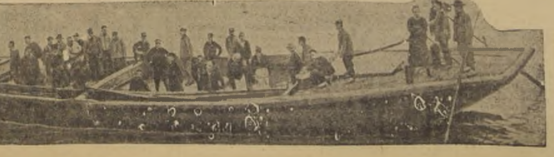
Otra banda de piratas orientales capturados recientemente por marinos norteamericanos