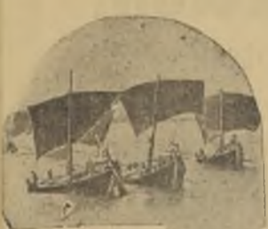
Arriba, en el círculo. Fotografía tomada de "contrabando" a tres juncos piratas. A la derecha, uno de los clásicos juncos piratas, en los cuales asaltan a los comerciantes y guardan las mercaderías. Son los juncos, recios barcos de madera que se ven hechos a la trenzada.

Cómo capturan los indefensos sampanes y los juncos de los comerciantes, y aun hasta los cañoneros de las potencias europeas, que viajan hacia el interior del país a lo largo de los grandes ríos. — Por qué no se ha podido aun exterminarlos