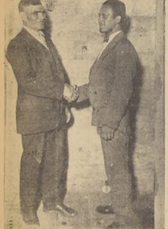
Rojas y López, los rivales del sábado próximo

Este encuentro se realizará en el Hippodrome Circo