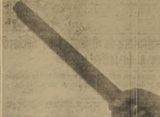
El pedazo de cañón con que se último a Moreno