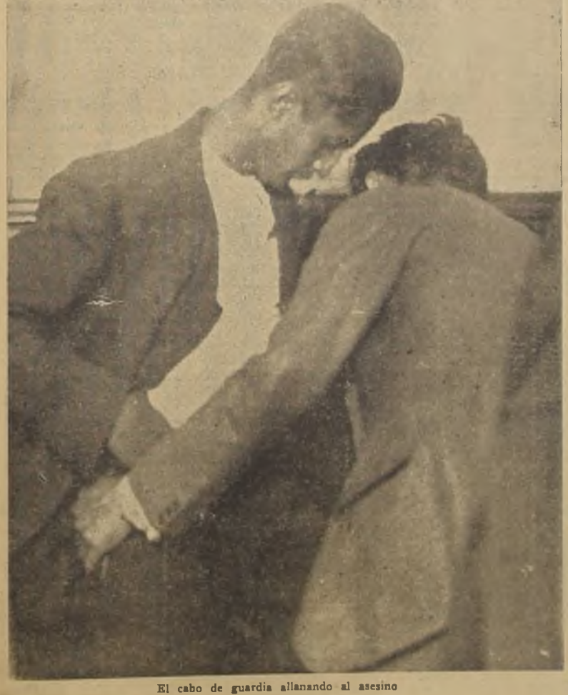
El cabo de guardia allanando al asesino