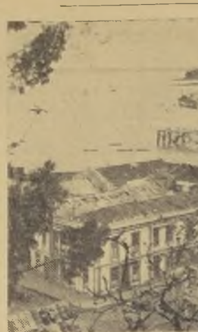
Vista panorámica de Puerto Montt

de defensa en épocas pasadas, que por poco tiempo, probablemente defendieron a la ciudad de las furias del mar. Pero hoy no hay allí ni defensas, ni cañes, ni aceras, ni nada.