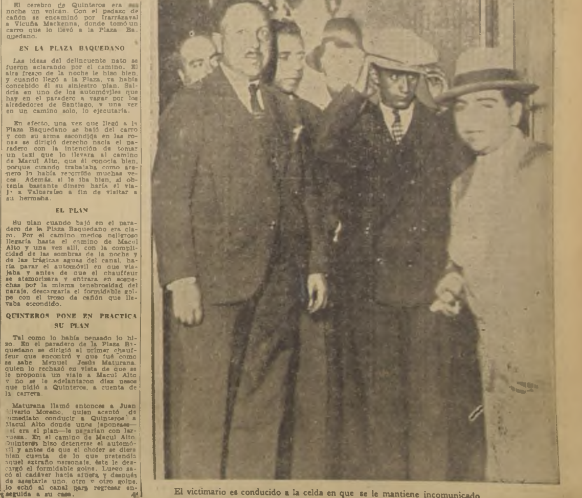
El victimario es conducido a la celda en que se le mantiene incomunicado