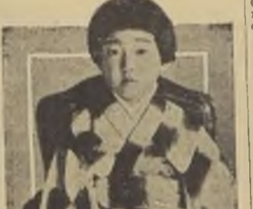
El día en que cumplía cuatro años, se sacó esta fotografía de la Princesita Teru, hija mayor de los Emperadores del Japón.