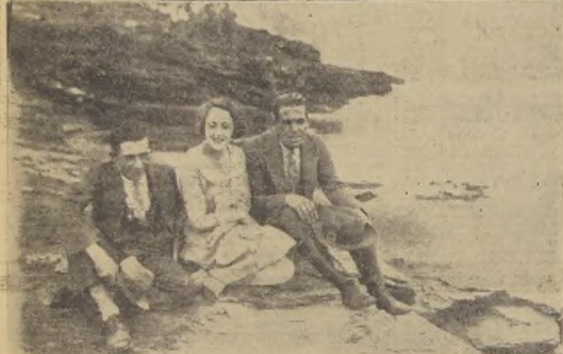
Verancantes en Curanipe