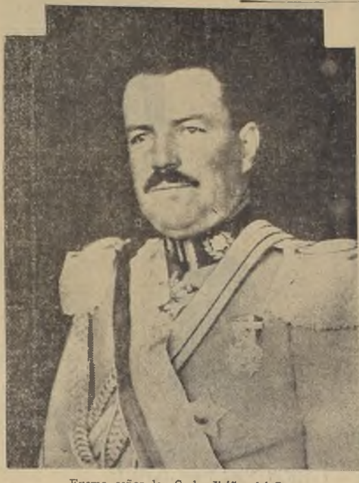
Excmo. señor don Carlos Ibáñez de Campo

La comunicación telefónica entre Chile y España, se establecerá a las 12.30 hora chilena, que corresponde a las 6.30 de España.