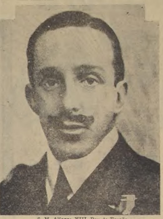
S. M. Alfonso XIII, Rey de España

La energía se aplica a la parte más próxima al terminal distante, con el nombre de Resonador. La sección posterior, situada detrás del resonador, se denomina Reflector y, como tal nombre lo indica, sirve para reflejar la energía radiada en la dirección que se desea, a la vez que para suprimir la radiación en sentido contrario.