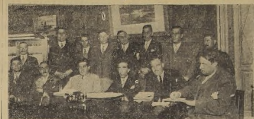
Entre las diversas comisiones de trabajo del Congreso Social Obrero de Chile viene adquiriendo especial importancia la nombrada para atender las necesidades y posiciones de las distintas poblaciones.

terceras reuniones, con la asistencia de los presidentes, secretarios y delegados de los distintos comités de poblaciones urbanas y sub-urbanas y en ellas se han estudiado las peticiones de estos organismos. La presente fotografía corresponde