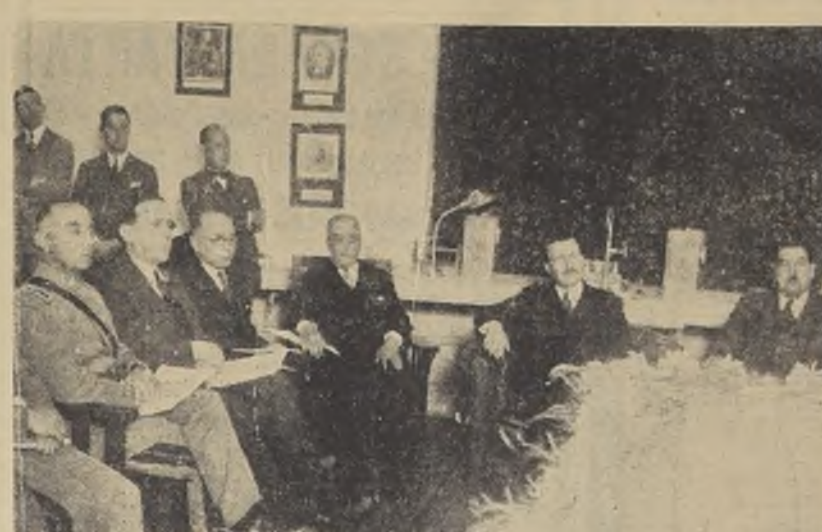
El Presidente de la República, Excmo. señor Ibáñez y Ministros de Estado, durante el acto inaugural de la Escuela Nacional de Higiene

El Sr. E. al Presidente de la República, acompañado del Ministro de Educación señor Navarrete, del Ministro del Interior señor Hermosilla, y del edecán comandante Acuña.