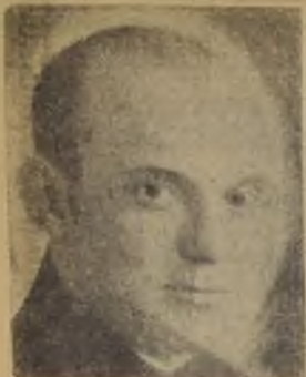
PARA MAYORES Y MENORES