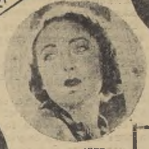
ANDREE LA FAYETTE