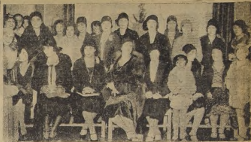
Grupo de damas que asistieron al aperitivo ofrecido por la Sociedad Laboratorio "Aurentia", en su elegante local de la calle Merced, con motivo de inaugurarse dicho establecimiento.