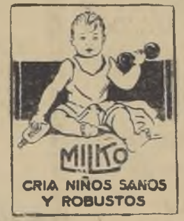
cria niños sanos y robustos

Las damas que usan los POLVOS HAREM se llevan tras sí los corazones.