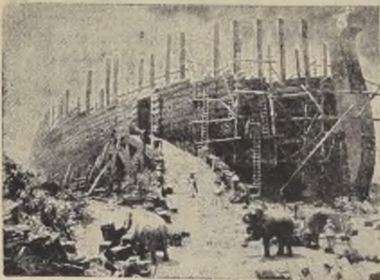
Ninguna producción cinematográfica había logrado despertar tanto interés en el público como "El Arca de Noé", película sonora que la Chilean Cinema Corp., presentará los primeros días del próximo mes en el Teatro Victoria.

Los cinematográficos norteamericanos en los últimos tiempos. Es pues, interesante dar a conocer al público algunos detalles de su filmación que demoró tres años de ardua labor a los talleres de la Warner Bros.