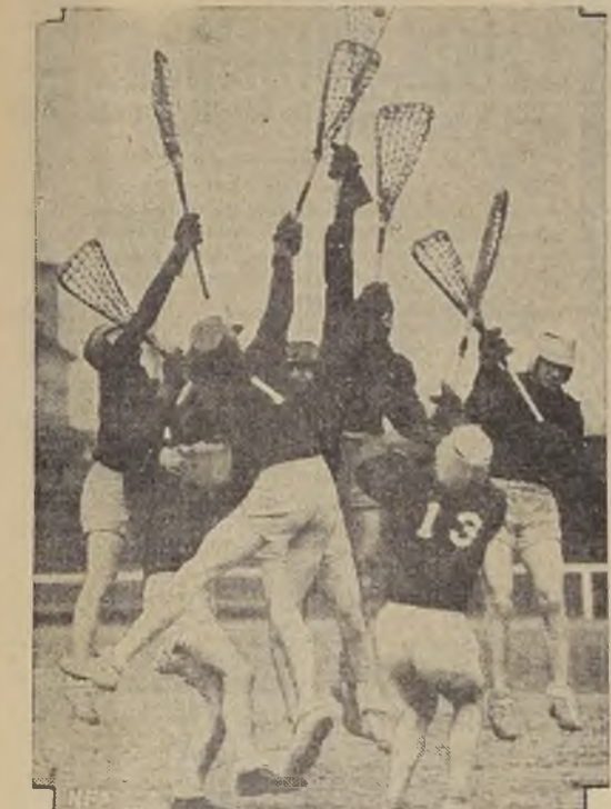
El juego de Lacrosse, uno de los más violentos que se conocen, apasiona a los estudiantes de Canadá, que lo practican mucho. Esta foto fue obtenida durante un match disputado en el Field del Instituto de Tecnología de Hoboken, Nueva Jersey, entre un team norteamericano y otro canadiense.