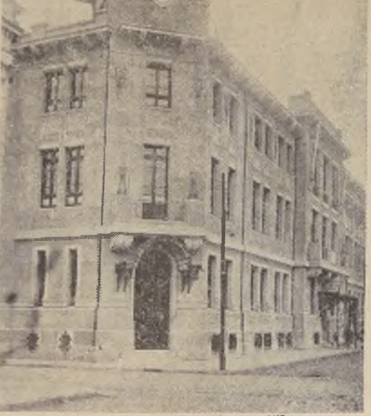
Nuevo edificio del Liceo Fiscal de Niñas