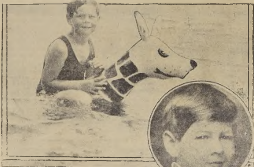
El Rey Miguel I, en las playas del Mar Negro, jugando con su caballo de goma.