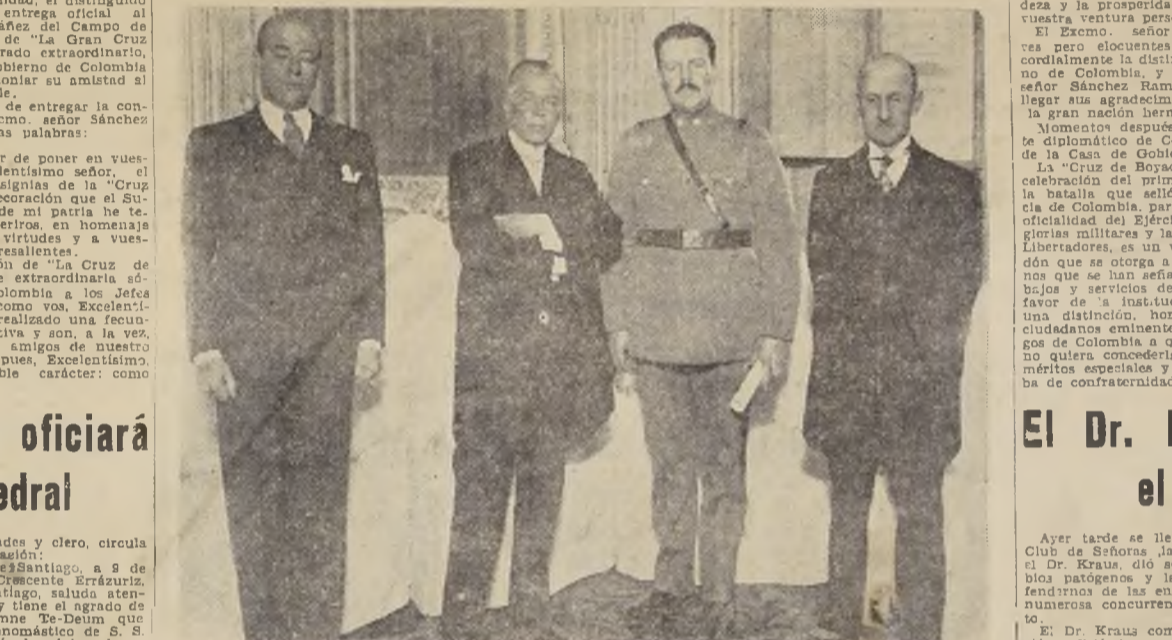
Después de la entrega de la Gran Cruz de Boyacá