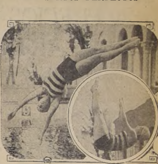
Dos saltos ornamentales perfectos, ejecutados por una nadadora norteamericana, en el reciente torneo nacional de Estados Unidos

Actualmente está afiliado a la Asociación Atlética de Santiago en donde sus actividades al no se han distinguido por su buena figura en las competencias; ha demostrado entusiasmo y dedicación. El décimo aniversario lo sorprendió en medio de una tarea de progreso y es así como se agregará a sus actividades la natación y el excursionismo.