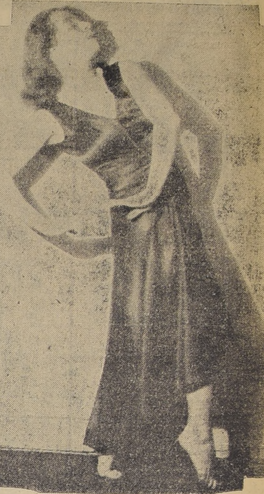
Una buena alumna del famoso compositor y maestro de danza, Emilio Jaques-Dalcroze, se presenta en la tarde de hoy a las cuatro y media, en el Teatro Principal, para hacernos sentir seleccionados trozos musicales de autores célebres, a través de sus admirables actitudes animadas que dan plasticidad y agregan un nuevo encanto a la emoción auditiva. Como podrán ver nuestros lectores en el detalle que copiamos más abajo, el programa de esta presentación rítmica no puede ser de mayor interés.

Primera parte Scarlatti.— Pastoral. Bach.— Preludio. Bach.— Sarabande. Segunda parte Rachmanninoff.— Preludio. Franck.— Danse lente. Allende.— Tonada. Ducass.— Preludio. Tercera parte Prokopleff.— Minuet. Debussy.— En bateau. Falla.— Danza de "Vida breve".