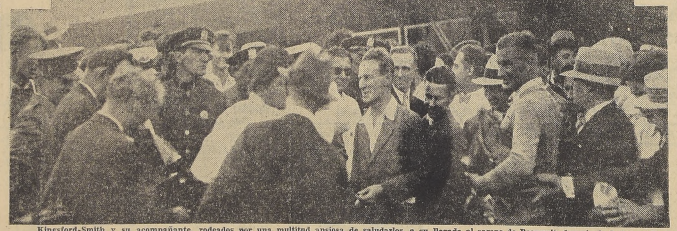
Kingsford-Smith y su acompañante, rodeados por una multitud ansiosa de saludarlos, a su llegada al campo de Roosevelt, después de haber realizado su vuelo a través del Atlántico, por la bahía Grace, en Newfoundland. Se ve junto al piloto del "Southern Cross" una guirnalda que fué obsequiada por Well Wisher. (Fotografía tomada el 26 de junio p.pdo. en New York).