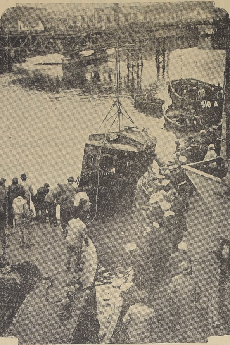
El tranvia que se precipitó al fondo del Riachuelo y causó la muerte de medio centenar de personas, en el momento de ser levantado.