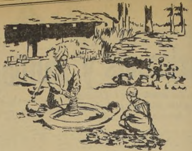
ALPARKO DEL HIMALAYA Dibujo de una fotografía Kodak tomada en la India

Hoy iniciamos una venta especial de CALZADO, MEDIAS, CALCETINES A PRECIOS MUY REDUCIDOS. ¡APROVECHELA!