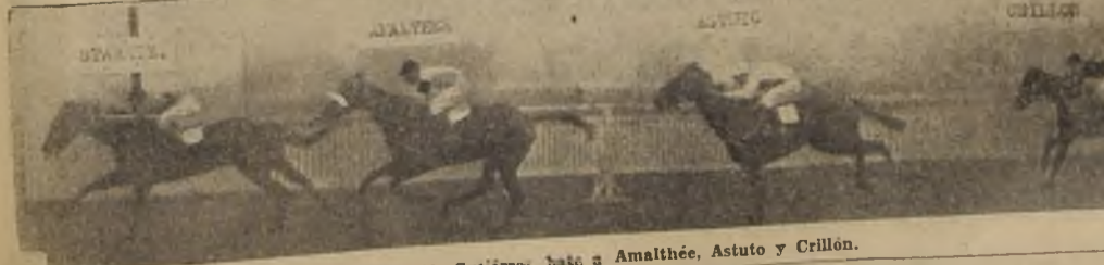
STARETZ (A. Gutiérrez, base a Amaltheé, Astuto y Crillón).