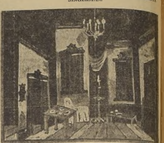
Un moderno decorado de la Compañía de Teatro de Cámara de Berta Singerman, que debuta el 16 del presente en el Comedia.

Como lo habíamos anunciado, desde hoy está abierto en la administración del Teatro Comedia un abono a cinco funciones extraordinarias de la Cia. de teatro de cámara de Berta Singerman, que debuta el 16 de agosto en el Teatro Comedia, donde realizará una corta y novedosa temporada.