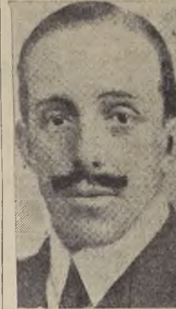
S. M. Alfonso XIII