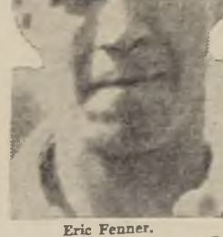
Un jugador de tenis