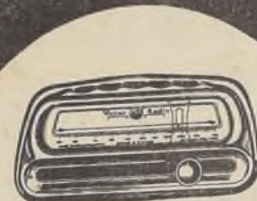
Sintonizador Superautomático Victor