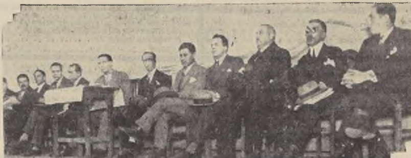
Mesa directiva que presidió la gran demostración pública de protesta contra los movimientos reaccionarios y de aplauso a S. E. el Presidente de la República, realizada el Domingo último por el Congreso Social Obrero de Chile, en el Teatro Esmeralda.