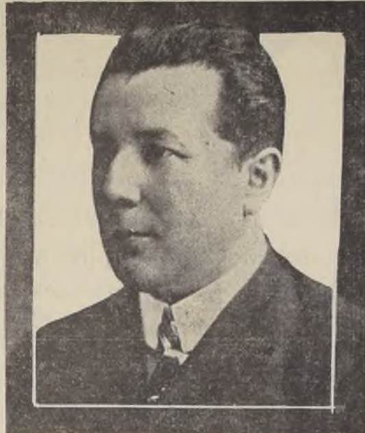
Don Enrique Tagle Moreno