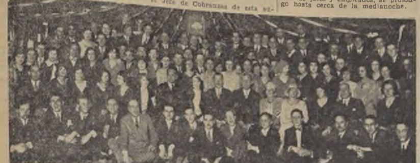
Grupo de asistentes a la manifestación del National City Bank.

El sábado en la noche se realizó un baile en The National City Bank, organizado por el personal a algunos jefes que han sido trasladados.