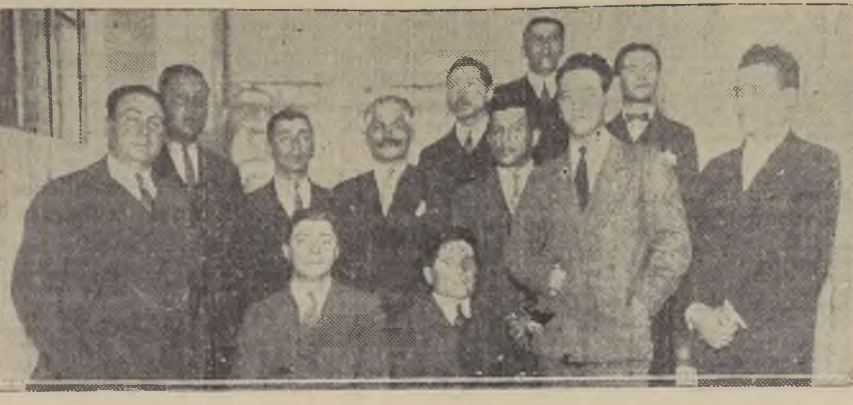
El nuevo Directorio de la Sociedad Manuel Montt, que regirá durante el periodo de 1930-1931.