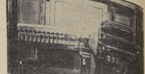
Las máquinas "clasificadoras" que en un día por tres mil personas se clasificarán, cuantas mujeres y cuantos hombres hay en Chile.