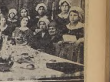
Una de las mesas arregladas por el Curso A de Artes Domésticas de la Escuela Técnica N.º 2.

Con los últimos adelantos modernos en este ramo se presentaron a examen individual las alumnas del curso de Artes Domésticas de la Escuela Técnica N.º 2.