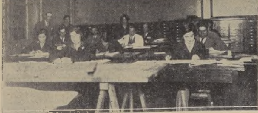
Personal que ha trabajado a las órdenes de la Comisión Central durante los preparativos del censo.