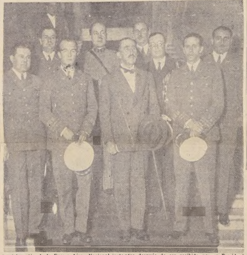
La delegación de la Fuerza Aérea Nacional instantes después de ser recibida por el Presidente Provisional de Argentina, General Uriburu.

Por la combinación transandina de mañana regresará a Santiago la delegación de la Fuerza Aérea Nacional que se dirigió a Buenos Aires, Mar del Plata, a fin de asistir a los ejercicios aéreos practicados por las escuadrillas del buque portaaviones británico "Eagle". Como se sabe, esta delegación la