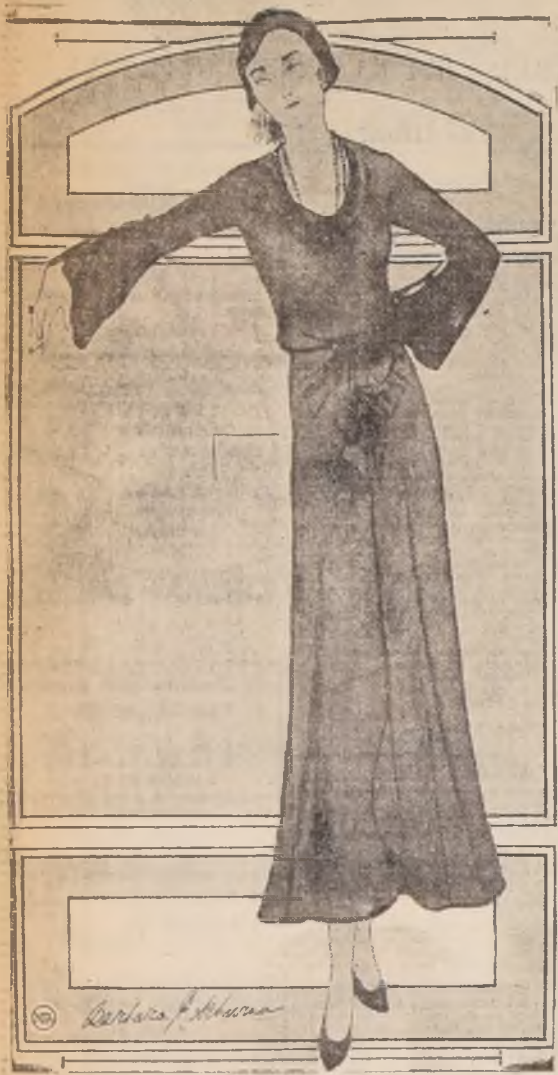
...a la última moda. Está confeccionado en satín negro, igual que el sombrero que se lleva con él.