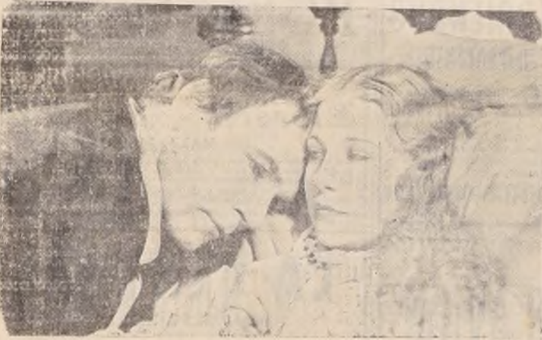
LA PELICULA DEL MUNDO Y PARA EL MUNDO, QUE OBTUVO EL 2.º PREMIO DE AÑO 1930.— ARTISTAS UNIDOS LA PRESENTA EN EL

LA PRIMERA PRODUCCION SONORA Y LA OBRA MAESTRA DE D. W. GRIFFIT.