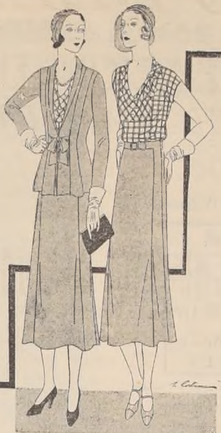
Dos aspectos del lindo ensemble de calle, combinación de pollera, blusa y saquito, sumamente chic.