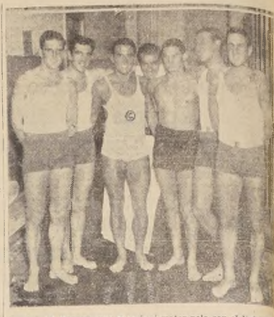
Cuadro del Hayduk, que ayer jugó water polo con el Universitario.

Además se realizaron las pruebas cuyos resultados consignamos a continuación: 100 metros al pecho, juveniles: Jerónimo de Las Heras; 20 Rolando Cavada. Tiempo: 1:43.35.