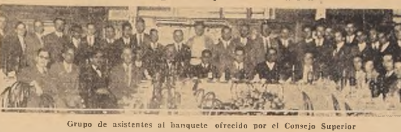
Grupo de asistentes al banquete ofrecido por el Consejo Superior

la Asociación Social y Deportiva de Providencia. — Asistió el Presidente del Congreso Social Obrero. — Detalles de los actos realizados el Domingo. — Aplauso a "La Nación"