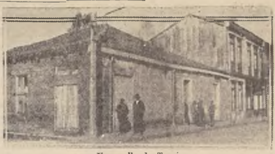
Una calle de Tomé.

TOME, 13. — La opinión pública se ha apasionado con la encuesta abierta por los correspondientes de los diarios de Concepción en este pueblo para determinar si es o no conveniente hacer plantaciones en la calle Portales y a los arbolitos que ahí se planten perjudicarán la estética del pueblo.