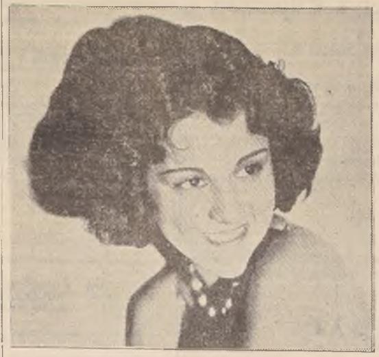
Desde luego, la causa fundamental es su falta de amor propio. Si, a su vez, un poco duro, pero es cierto. La balanza como también la medida de sus cualidades, deberán prevalecer cada uno o dos meses. Entonces será conveniente que le diga a su imagen en el espejo, la opinión que le

causa. Podría reflexionar acerca de si su figura es de aquellas que pueden atraer la atención de la mujer en general, y por consiguiente, de una mujer en su caso particular. Después, cuando haya llegado a la decisión, deberá tener el estímulo para poner en práctica el remedio a sus defectos.»