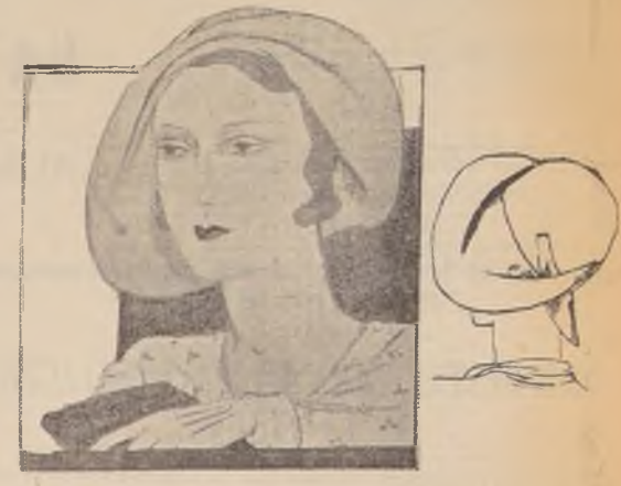
MARCELLE ROZE. Los modistos tratan de hacernos adoptar los sombreros más grandes. Este sombrero de fieltro cáscara deja la frente y los cabellos descubiertos. Al lado el mismo sombrero visto de espaldas.