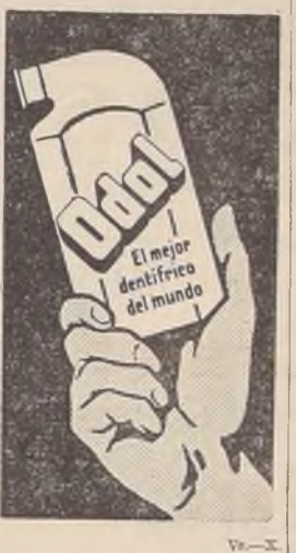
El mejor dentífrico del mundo