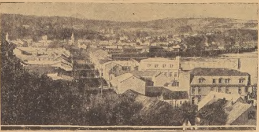
Vista panorámica de Puerto Montt. Fueron contratadas con la firma Wikström y Widmann el 29 de noviembre de 1929 por la cantidad de $ 9.837,067, 29 pesos. Las alineaciones del proyecto fueron entregadas a la firma constructora en octubre de 1930.

Lo que se ha hecho, según datos contenidos en la memoria de la Intendencia de Chiloé.— El dragado del canal de Tenglo.— Construcción de bodegas, maestranzas y habitaciones para obreros en la Isla.