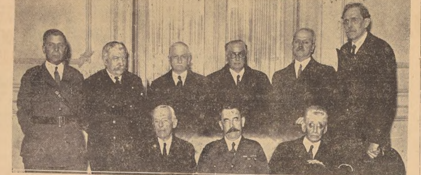
El jefe de la Revolución en la Argentina y Presidente del nuevo Gobierno Provisional, general José Francisco Uriburu, rodeado de sus secretarios-Ministros: a su derecha, el doctor Ernesto Bosch (Relaciones Exteriores); a su izquierda, el doctor Ernesto S. Pérez (Hacienda); detrás, de izquierda a derecha, general Francisco Medina (Guerra); contralmirante Abel Renard (Marina); doctor Octavio S. Picó (Obras Públicas); doctor Enrique Santamarina (Vice-Presidente); doctor Ernesto Padilla (Justicia e Instrucción Pública); doctor Adrián Becar Varela (Agricultura). Falta en esta fotografía el doctor Matías G. Sánchez Sorondo (Ministro del Interior).

CHALETES EN PROVIDENCIA O ÑUÑA COMPRAMOS Necesitamos urgente para clientes únicos de esta oficina, los siguientes chalets. Impóngase personalmente de los numerosos pedidos que tenemos. Conviézanse que nuestra oficina es la que mejor atiende a su clientela. a) Chalets en Providencia cerca de carros de un valor de $ 50.000 a $ 70.000. Tenemos 3 pedidos urgentes. b) Chalets en Providencia de un valor de $ 80.000 a $ 100.000, se paga al contado, indispensable tenga garage y jardín. Se necesita para el 1.º de mayo. c) Chalets en Providencia, con buena recepción, jardín y garage de un valor de $ 150.000 a $ 200.000. Mínimum 5 dormitorios. En barrio Ñuña necesitamos casas o chalets modernos de un valor de $ 40.000 a $ 100.000. 15 — GALERIA ALESSANDRI — 15 LUIS SILVA CORTES & CIA.