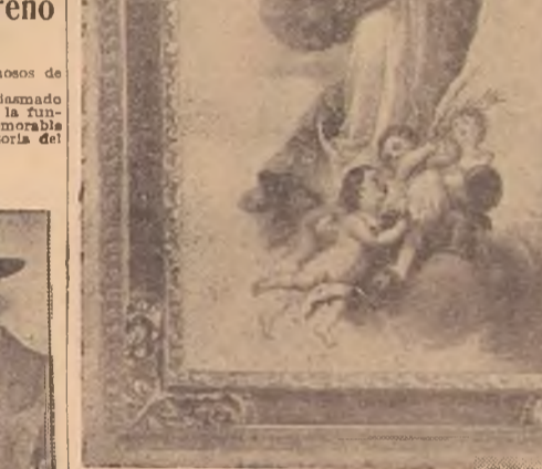
LA INMACULADA CONCEPCION, POR MURILLO Museo del Prado, Madrid

En nuestra nota anterior sobre las admirables reproducciones de cuadros de los maestros europeos antiguos y modernos más célebres, de las que es concesionaria exclusiva esta Sala, hechas en ciertos procedimientos de reciente invención, está en el tamaño mayor que nos ha tocado en suerte por ser una reproducción fina, ciento treinta centímetros de alto por ochenta de ancho; habiendo otra de este mismo cuadro en tamaño mediano. Otros dos, bien aproximadamente, un metro de altura y la última es de unos 34 de metro.