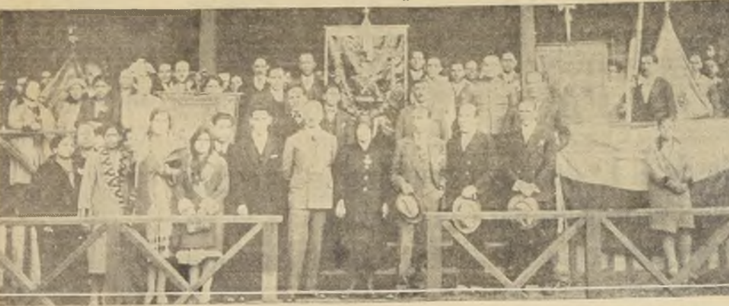
Durante la ceremonia de la bendición del estandarte del Sindicato...