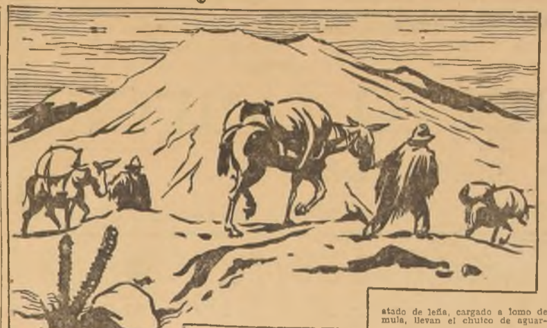
Huelga. estado de leña, cargado a lomo de mula, llevan el chulo de aguardiente.

ESTRATAGEMAS. Pero hay otros "huachucos" que, al no negociar tan en grande, tampoco corren los riesgos de los otros. Se limitan a vender alcohol a nivel de los puertos de entrada, en cualquiera de las caletas de la zona de Punta del Viento o de Machalí, que son infame y peligrosos. Lo más común es que el infame o el desleal sea asesinado. Así se le asesinó a uno de los socios de un "huachuco" que no había permitido que se le fuera a vender alcohol a un indio que se lo había vendido a un precio más bajo que el que le ofrecía. Algunos "huachucos" usan "casacas", anchos cinturones con clavijas como las de esos que sirven de cartucheros, y las cuales colocan en las botellas de alcohol, que cubren con el poncho. Y otros entran a las minas como los artesanos. Pero en el interior del