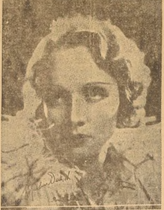
Marlene Dietrich, la talentosa rival de Greta Garbo, que aparecerá el martes próximo en el Real, en la admirable super-producción Paramount, "Morocco", que conmovió a Santiago entero.

MUEBLES DE TODOS ESTILOS A PRECIOS BAJISIMOS VENDE La Universal Damos facilidades en el pago. Entrega inmediata. CATEDRAL 1131 V. S.—G.