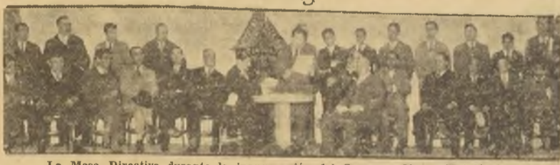
La Mesa Directiva durante la inauguración del Congreso Obrero Metalúrgico.

En la mañana de ayer se inauguró en el Teatro Politeama, el Congreso de Obreros Metalúrgicos, en cuyo torneo participan varias delegaciones de provincias y de la capital, de todos los elementos que laboran en la industria del metal.