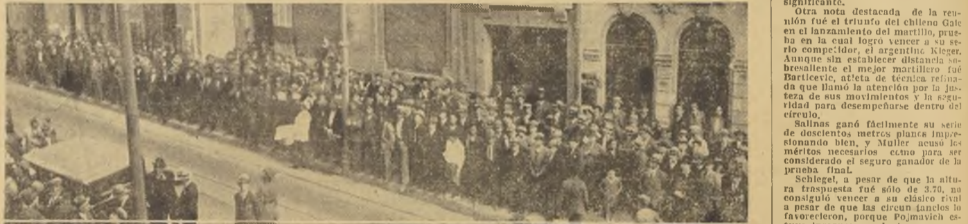
Público estacionado frente a nuestro diario, se impone de los resultados de la segunda etapa del torneo, que le fueron proporcionados mediante nuestros altos parlantes.

Indiscutiblemente, quien acusa mayor perfección en esta prueba, con una distancia en la prueba, consiguió interrumpir la carrera de triunfos que había estado efectuando en la capital del Perú, en el Campeonato de Montevideo en 1929, con 46.16 metros, en Santiago con 46 metros y en Lima con 49.56.