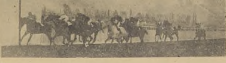
Pique (palos) derrota estrechamente a Digno y Astuto. Más atrás, Royal Beauty, Crillón, Biribi, Genesserine, Richeesse, Auco y Andaluz.

El ganador de la carrera, Pique, fue conducido magistralmente por el piloto R. Olguin, que al final consiguió una pasada imposible por el lado de los palos. Los tramos finales, fueron del más alto interés, pues a 100 metros para la raya, era imposible prever, quien sería el vencedor, entre Digno, Crillón, y Digno, viéndose a continuación, Genesserine, Richeesse, Andaluz, Pique y Royal Beauty, orden en que aparecieron en la recta final. El puntero, mantuvo sus posiciones hasta el comienzo de las galerías, en donde Digno, fue el primero en darle alcance, pero allí también se hicieron presentes, Astuto, y Crillón, por fuera, y Pique por el lado interior. En el instante de partir, rodó Bodas de Oro. Cubiertos los primeros 300 metros, Auco pasó violentamente al puesto de honor, quedando entonces segundo Biribi, y a escasa diferencia Astuto, Crillón, y Digno, viéndose a continuación, Genesserine, Richeesse, Andaluz, Pique y Royal Beauty, orden en que aparecieron en la recta final.