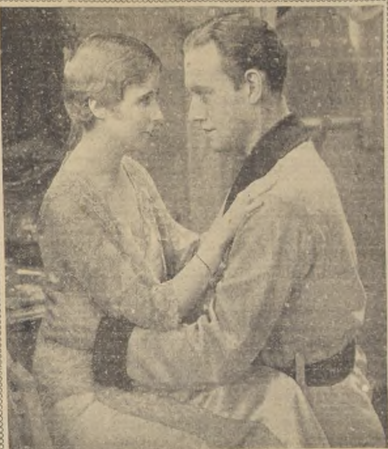
La incomprensión y frialdad de una esposa arrojaron en los brazos de su mejor amiga al marido desilusionado.