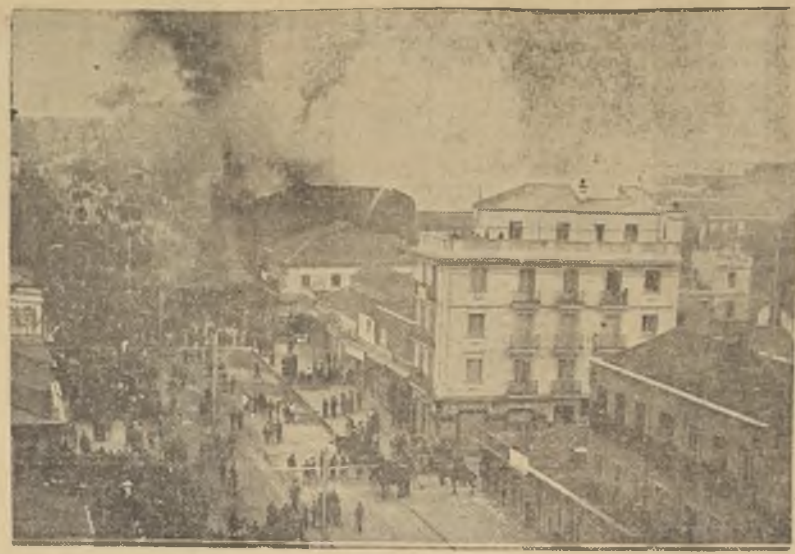
El Convento de Maravillas, incendiándose. — Madrid.