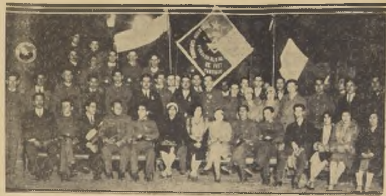
Grupo de asistentes a la recepción ofrecida por el Sindicato, en la Casa del Pueblo, con motivo de la bendición del estandarte social.