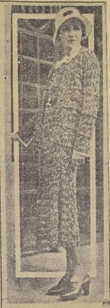
Patou es el creador de este precioso modelo de vestido de mañana, sin mangas, con chaqueta de manga larga para completar el ensemble. Es de lana roja y blanco, en la cual este último color forma el dibujo moderno del tejido.

cambio de estación. Una de esas novedades es la que se refiere a la composición del mismo vestido. La moda actual se inclina al