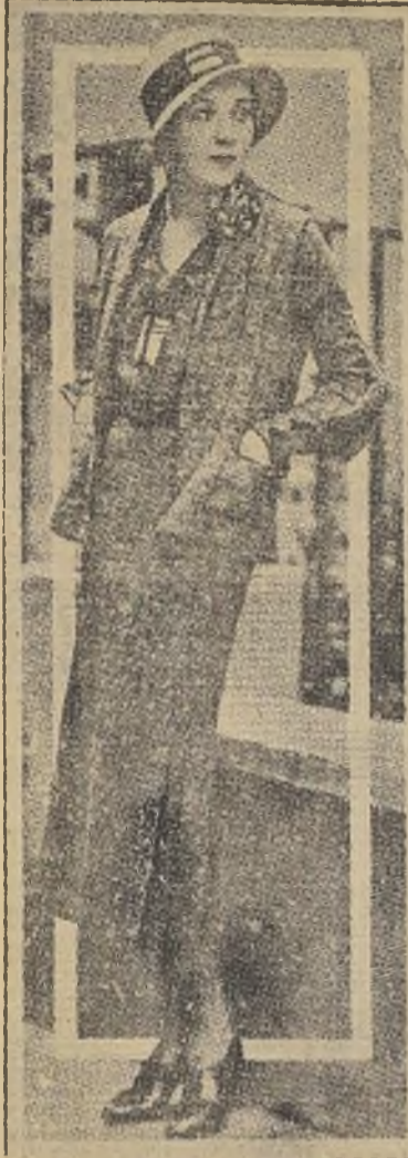
Un lindo traje de mañana en jersey beige y marrón, original de Jean Patou. Lleva, sobre el vestido de mangas largas, una chaquetita sin mangas.

Lo con mangas, o vice-versa. Estos saquitos modernos son una nueva versión del "cardigan", que hace unas temporadas con-