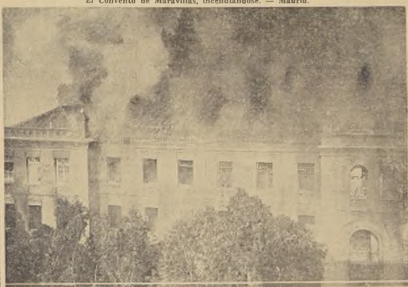
Otro aspecto del Convento de Maravillas.

"La Nación" presenta en esta página la primera información gráfica de los disturbios ocurridos en España el 11 y 12 de este mes, durante los cuales fueron incendiados numerosos conventos y templos de Madrid, Sevilla, Valencia, Cádiz, Alicante y otras ciudades hispanas.