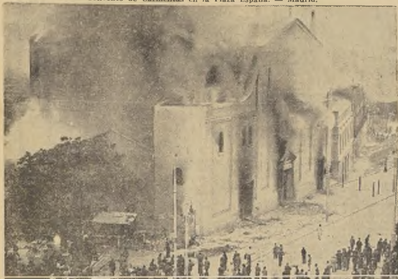
El convento de la calle de la Flor, Madrid, primero en ser quemado.