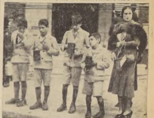
Una comisión de cieguitos acompañada de una directora de la Sociedad Santa Lucía.

Desde temprano, más de ciento treinta comisiones de señoras recorrieron las calles de la ciudad en cargo la colecta y la generosidad manifestada en forma elocuente por el público y el comercio.